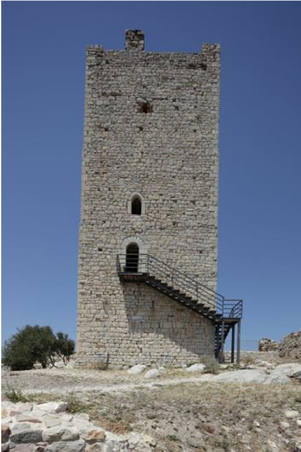
Fig. 4 - La torre del Castillo della Fava con la entrada elevada en relación con el nivel de la plaza de armas.