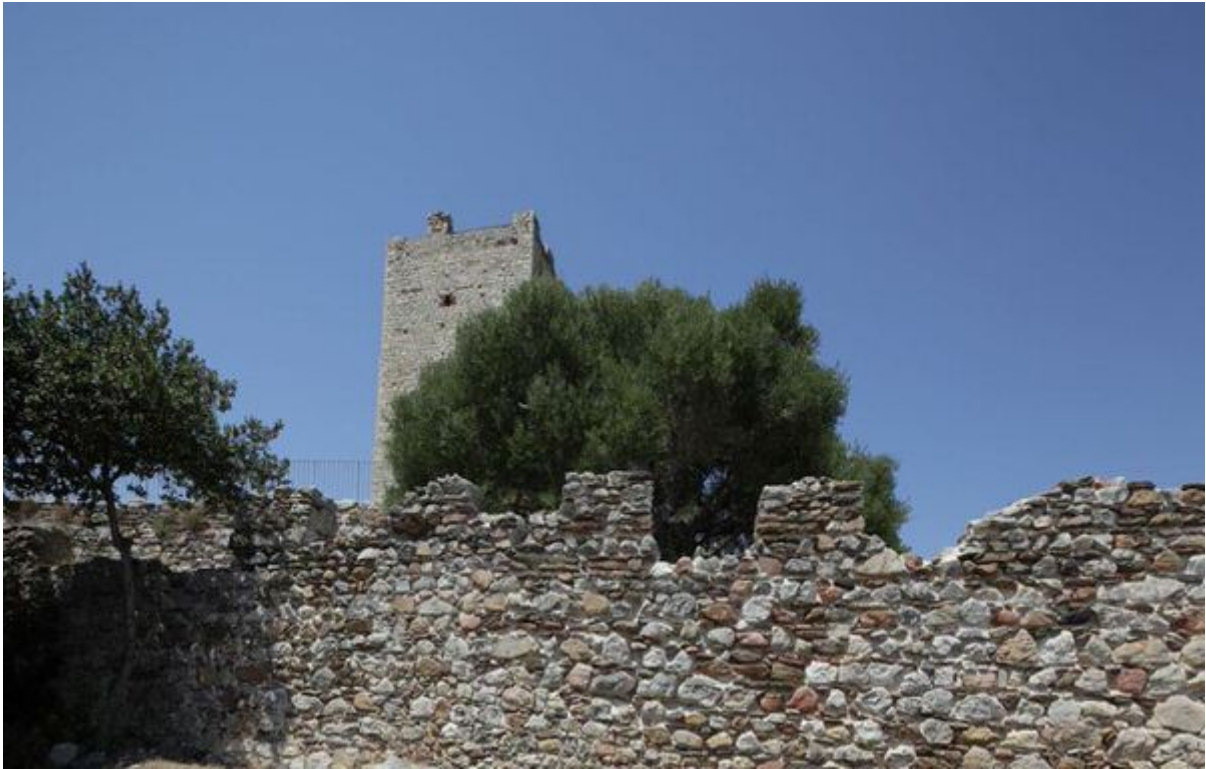
Fig. 3 - Las murallas y la torre del Castillo della Fava

La torre tiene una altura aproximada de 20 metros y está caracterizada por una entrada colocada a un nivel superior respecto al nivel de la plaza de armas. El acceso a la torre (a la cual hoy en día se puede acceder a través de una escalera de hierro) se realizaba mediante una escalera de madera o incluso una cuerda, que podían mover rápidamente para impedir la entrada del enemigo que llegara hasta allí (fig. 4). La torre estaba coronada por almenas, mientras que el espacio interior estaba dividido en tres pisos conectados por empinadas escaleras de madera. Las pequeñas aberturas de las paredes permitían iluminar los ambientes y controlar el territorio.