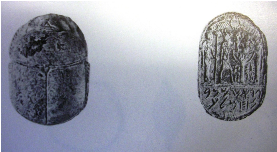
Fig. 9 - Escarabeo con jeroglífico de la colección Biggio de Sant'Antioco (de Moscati 1988, lám. XXXI, fig. 5).