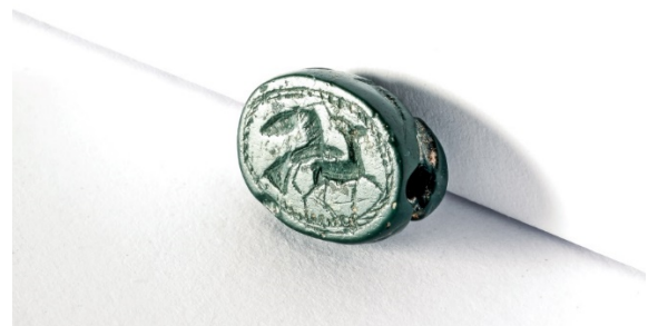
Fig. 6 - Dorso y base ovalada del escarabeo de jaspe verde con la iconografía de un cervido agarrado por un águila, Museo arqueológico "F. Barreca".

Tanto el verde del jaspe, como el rojo de la cornalina eran colores vinculados con el renacimiento, que a menudo usaban para crear otros amuletos. El escarabeo sí que era un amuleto y por eso tenía una cierta función de protección al acompañar al difunto al más allá. Aunque también se consideraba un sello personal que podría haber representado el signo de reconocimiento de algún funcionario, de un sacerdote o de una persona acaudalada con un rol importante en la sociedad. También se ha hipotetizado que podrían identificar a una familia y ser auténticos emblemata sociali , sin excluir los vínculos con los cultos místicos a los que algunos iconos (Ísis, Bes, etc.) podrían hacer alusión. El uso práctico del escarabeo como sello se ha podido demostrar gracias al hallazgo de numerosas crétulas en varios yacimientos, como en el de Selinunte y Cartago, donde se han hallado respectivamente 600 y 4000 ejemplares (fig. 7), y en Cerdeña, en Cuccureddus , de Villasimius, donde hasta ahora solamente se han encontrado 5.