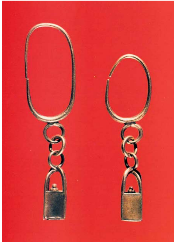
Fig. 3 - Pendientes con colgantes con forma de cesta, de Tharros. Museo arqueológico nacional de Cagliari (de Acquaro 1984, pág. 20, fig. 7).