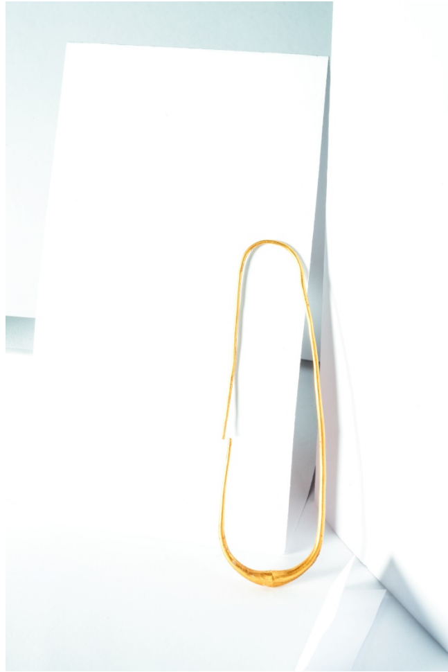
Fig. 2 - Pendiente de tipo «sanguijuela» de la tumba 9 AR de la necrópolis de Sulky . Museo arqueológico "Ferruccio Barreca".

El tipo de pendiente de «sanguijuela» estuvo muy difundido en el ámbito de la orfebrería fenicio-púnica y está caracterizado por una forma simple o decorada como, por ejemplo, con colgantes (figs. 3-4) o aplicaciones variadas, entre las cuales se distinguen las realizadas con la técnica de la filigrana y de la granulación (fig. 5) que son técnicas más raras en los ejemplares hallados en Sulky hasta la fecha.