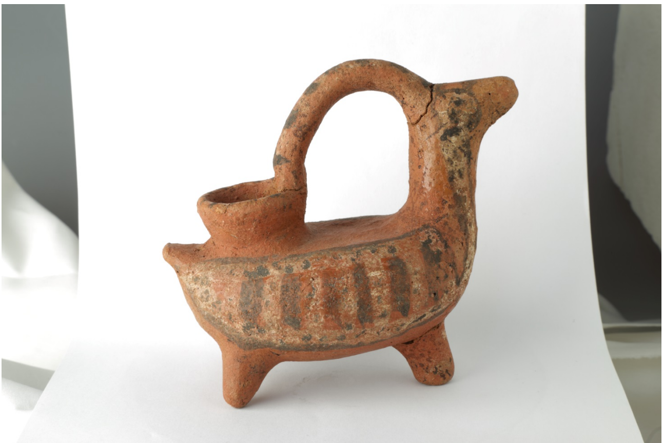
Fig. 1 - Askos ornitomorfo de Sulky. Museo arqueológico "Ferruccio Barreca".

El ejemplar (figs. 1 y 2), que pertenece a la clase de recipientes ornitomorfos, está dotado de tres pies, uno anterior y otro posterior, su cuerpo es alargado, tiene el cuello alto y una pequeña cabeza con la punta redondeada que representa el pico, con un orificio. El asa nace de la parte posterior de la cabeza y se arquea hacia la mitad del cuerpo, que se une con la abertura, que tiene un pequeño cuello tipo embudo con el fondo con orificios para crear un filtro.