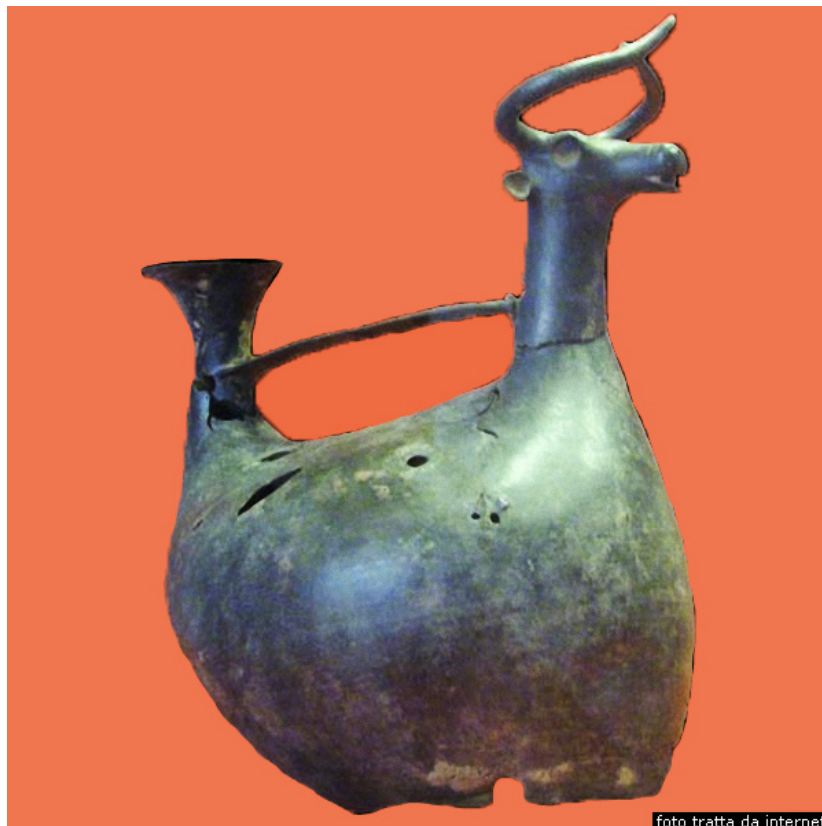
Fig. 6 - Askos de bronce de la aldea nurágica de Sa Sedda y Sos Carros

Los materiales púnicos se conservan, ligeramente, fieles a los originales egeos y chipriotas, como podemos observar también en este ejemplar. Su función primaria era la de contenedor de líquidos o, más probablemente, de ungüentos. Hipótesis que ha sido confirmada en este caso por la superficie perforada en la base de la abertura, que usaban para filtrar hierbas aromáticas.