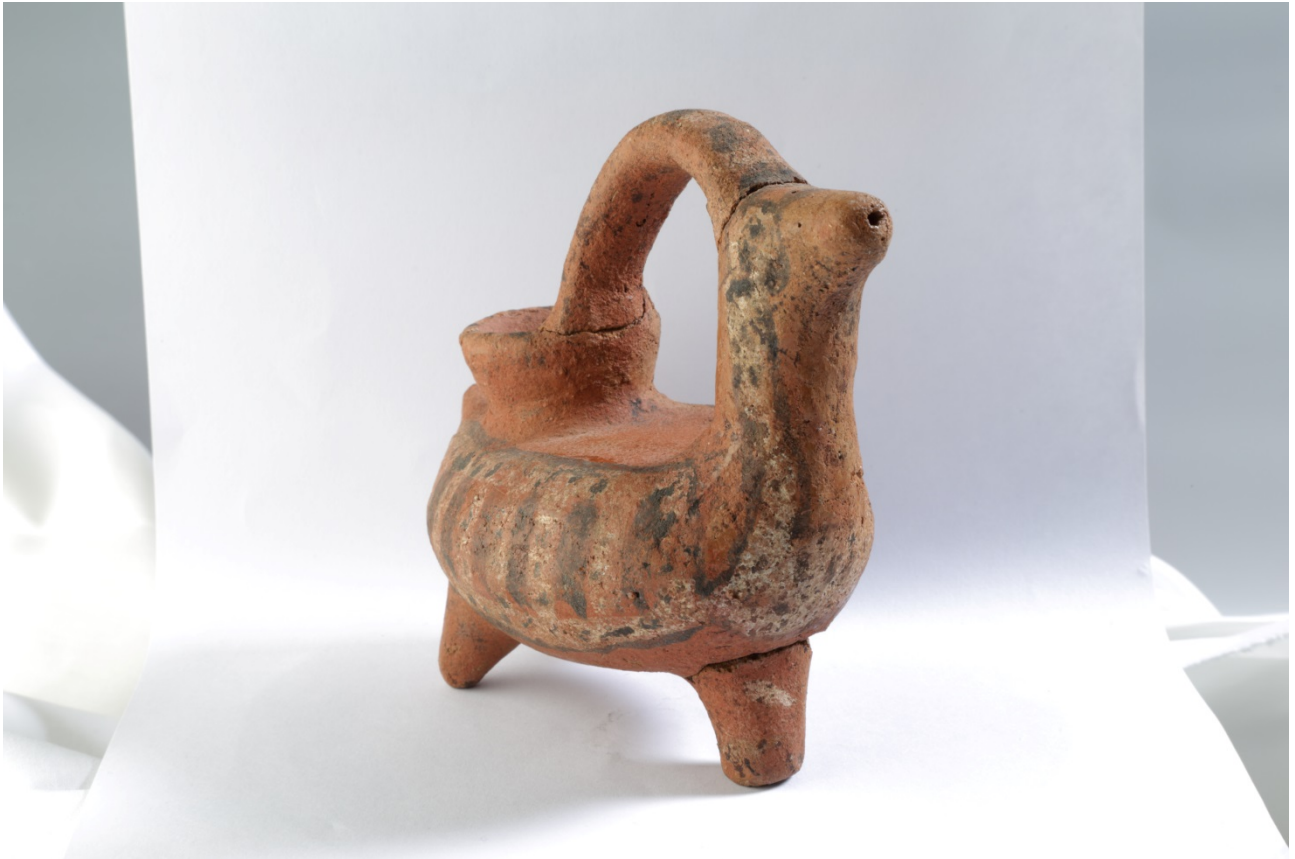
Fig. 2 - Askos ornitomorfo de Sulky. Museo arqueológico "Ferruccio Barreca"

El extremo posterior del askos tiene forma puntiaguda para representar la cola del ave. La forma de la jarra está completada por una decoración de color negro y blanco sobre la superficie roja de la terracota. A través de un borde negro se delinean las partes del cuerpo del ave: las alas, el pecho y la cabeza, con un relleno blanco en el que se observa, de nuevo, pintura negra para estilizar el plumaje a través de puntos y líneas oblicuas. Además, el asa también luce las típicas líneas horizontales con colores alternos entre el negro y el blanco.