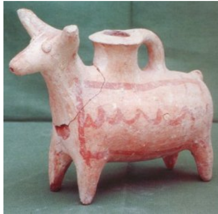
Fig. 5 - Askos con forma de bovina de Motia. Museo arqueológico de Motia "G. Whitaker".

Los materiales púnicos se conservan, ligeramente, fieles a los originales egeos y chipriotas, como podemos observar también en este ejemplar. Su función primaria era la de contenedor de líquidos o, más probablemente, de ungüentos. Hipótesis que ha sido confirmada en este caso por la superficie perforada en la base de la abertura, que usaban para filtrar hierbas aromáticas.