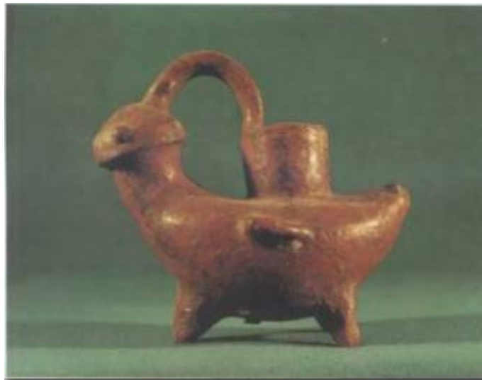
Fig. 3 - El askos de Sulky con forma de paloma. Museo arqueológico nacional de Cagliari.

Una de las más comunes es la del caballo (fig. 4) y la de forma de bovino (fig. 5). Además, no sólo usaron terracota, sino que también se han hallado askoi de bronce (fig. 6).