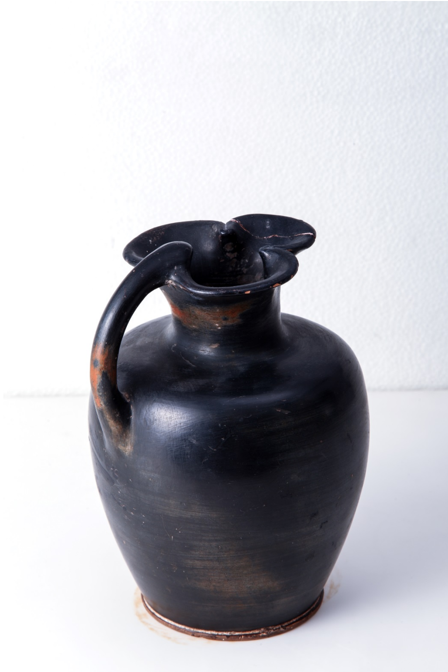
Fig. 3 - Enócoe de Sulky

El enócoe de Sulky se puede datar de finales del siglo VI y el siglo V a.C. porque, desde la conquista cartaginesa de Cerdeña y durante todo el siglo IV a.C., la única cerámica griega de importación que se usó en las localidades púnicas era la ática, es decir, la que se producía en Atenas y en la región de Ática (fig. 3). Con anterioridad, es decir, a partir de