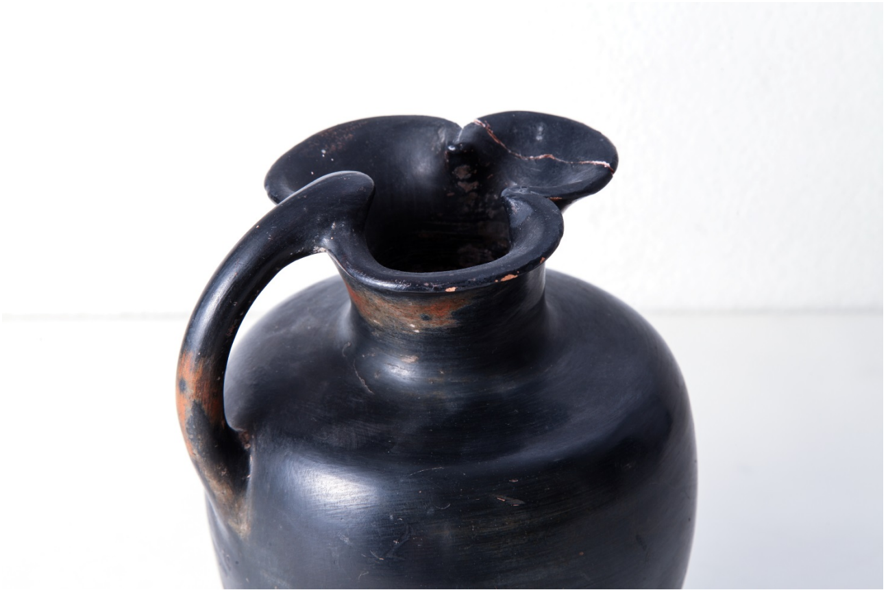
Fig. 2 - Enócoe de Sulky. Detalle de la jarra (foto de Unicity S.p.A.).