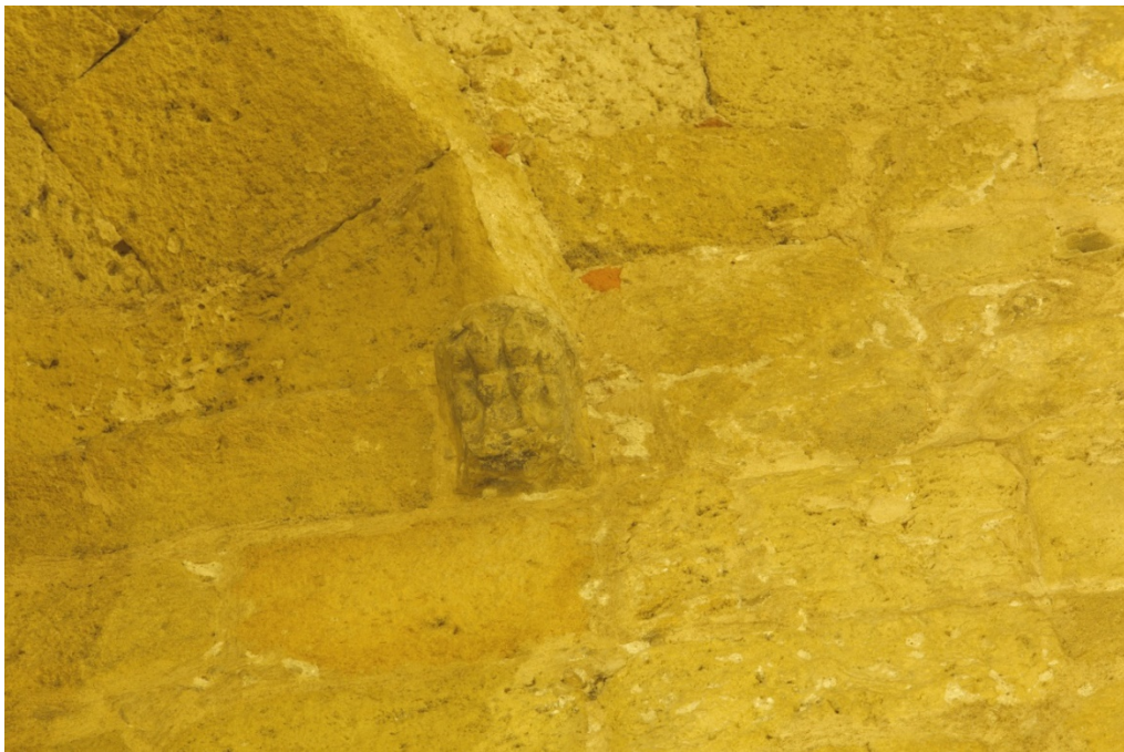
Fig. 7 - Sant'Antioco, ménsula de la cúpula con forma de pata de león.