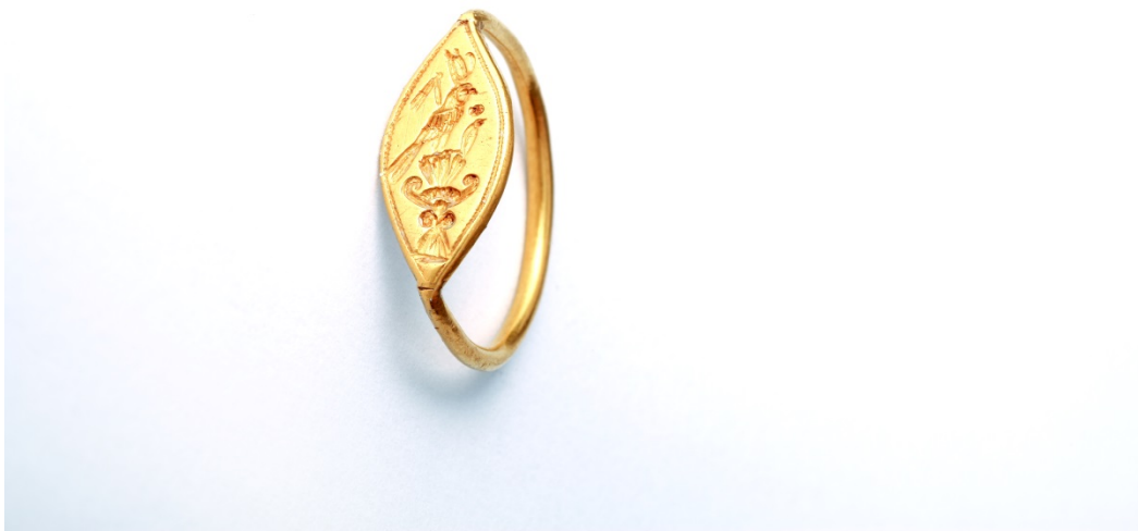
Fig. 7 - Anillo de oro que representa a Horus el halcón con insignias del poder egipcio. Museo arqueológico "Ferruccio Barreca".

Por lo tanto, colocaban al difunto entre estos objetos, enterrado o incinerado, en tumbas de cámara de hipogeos y, a menudo, lo adornaban con joyas y collares (fig. 7). Según las costumbres tradicionales, la persona enterrada se cubría de resinas y ungüentos perfumados con el fin de terminar con el mal olor de la descomposición y, quizás, para retrasarla.