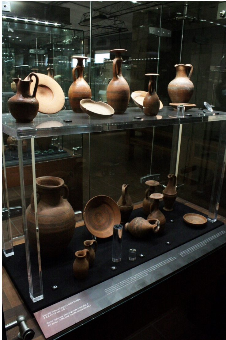
Fig. 2 - Ajuares funerarios de la tumba 9 AR de Sulky (sig. V-IV a.C.). Museo arqueológico "Ferruccio Barreca".

Para realizar tan largo viaje, al lado del difunto colocaban objetos de carácter mágico-religioso: en primer lugar, amuletos, cuya función era defender al difunto contra malos espíritus (fig. 3); máscaras de carácter apotropaico, es decir, que tenían la función de alejar a los espíritus malos (fig. 4); una lámina de oro o plata que representara el juicio de los muertos inspirados, muy probablemente, en textos egipcios, e introducida en un portamuletos de oro o plata con forma de divinidad egipcia o de un pequeño pilar (fig. 5); los escarabeos, en parte amuletos, en parte sellos, usados en vida y que se llevan consigo a la tumba (fig. 6).