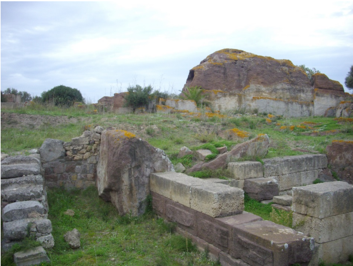
Fig. 1 - Restos de construcción sobre la acrópolis de Sulky

Lo que queda del anfiteatro romano de la antigua Sulky se halló a finales de 1983, en la base de una pendiente donde también se encuentra la necrópolis púnica con tumbas de cámara hipogeica. De hecho, el área de los sepulcros, durante el siglo II, a.C., es decir, en el período de la Roma republicana, sufrió obras para crear un acceso monumental de la acrópolis, cuyos restos se encuentran en los pies del fuerte Su Pisu, hacia el norte. En la acrópolis (fig. 1) se conservan los restos de un edificio templario con escaleras, con una estructura parecida a la de la calle Malta de Cagliari (fig. 2).