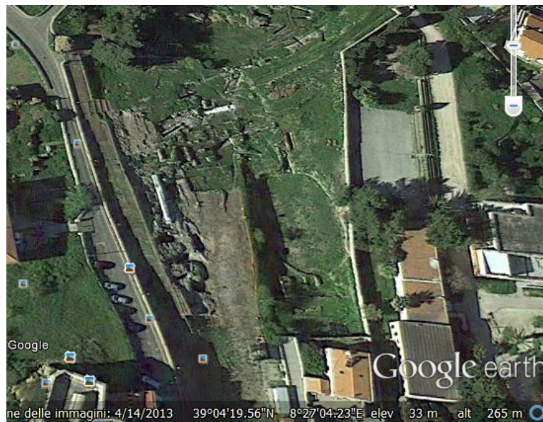
Fig. 3 - La elipse del anfiteatro de Sulky vista desde lo alto (elaborado por C. Olanas, de Google Earth).

Crearon una amplia área elipse (fig. 3), orientada según el eje norte-sur, cuya cávea fue construida en material deteriorable, probablemente madera, según una técnica que también se usó en Nora.