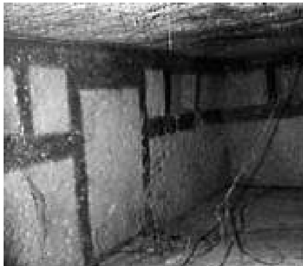
Fig. 6 - Detalle de la puerta decorativa de la tumba 7 (de Bernardini 2007, pág. 156, fig. 10).

El análisis de los restos pictóricos de las tumbas sardas nos permite tener un cuadro bastante exacto de la complejidad y riqueza de este patrimonio que va desde el anicónico geométrico al icónico: las franjas y las líneas son las decoraciones más frecuentes y las primeras se encuentran en la tumba nº 7 de Sulky, que también incluye, como hemos visto, decoración en relieve. Existen otros tipos, que según los datos actuales no salieron a la luz en la necrópolis púnica de Sulcis, como los que reproducen elementos arquitectónicos; cruces de Sant'Andrea (una especie de estrella con 8 rayos porque se trata de cuatro líneas que se cruzan en el centro; elementos geométricos, como los losanges, que eran muy