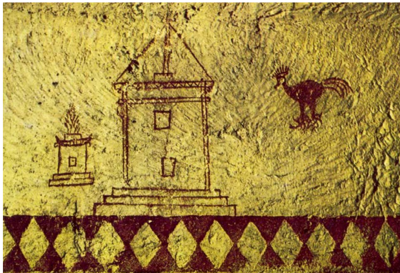
Fig. 2b - Pared pintada de color rojo de un hipogeo púnico de Gebel Mlezza, que data del siglo IV-III a.C. (de Moscati 1972, p. 449)