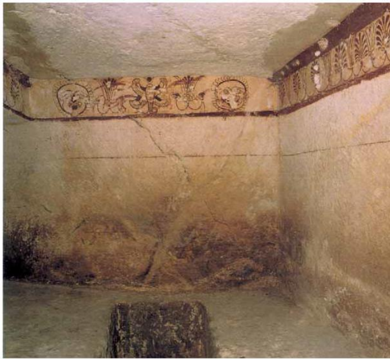
Fig. 1 - Tumba denominada «dell'Ureo» en la necrópolis de Tuvixeddu (CA) con frisos pintados de rojo.

La necrópolis de Sulky tiene pocos hipogeos con decoración pictórica. A pesar de las escasas muestras, la pintura funeraria es uno de los elementos más distintivos de la necrópolis de cámara hipogeica de la Cerdeña púnica. En este sentido, el rico patrimonio de Cagliari representa el ejemplo más importante del Mediterráneo junto con el de CaBo Bon, en la costa nororiental de Túnez. La pintura funeraria sarda de la era púnica prácticamente se ignoró hasta el descubrimiento, en la necrópolis de Tuvixeddu (CA), de las tumbas llamadas "del Sid" e "dell'Ureo" (fig. 1) que, junto con las de la necrópolis de Kerkouane (Gebel Mlezza), en Capo Bon (figs. 2a-b), representan algunas de las muestras más complejas e interesantes.