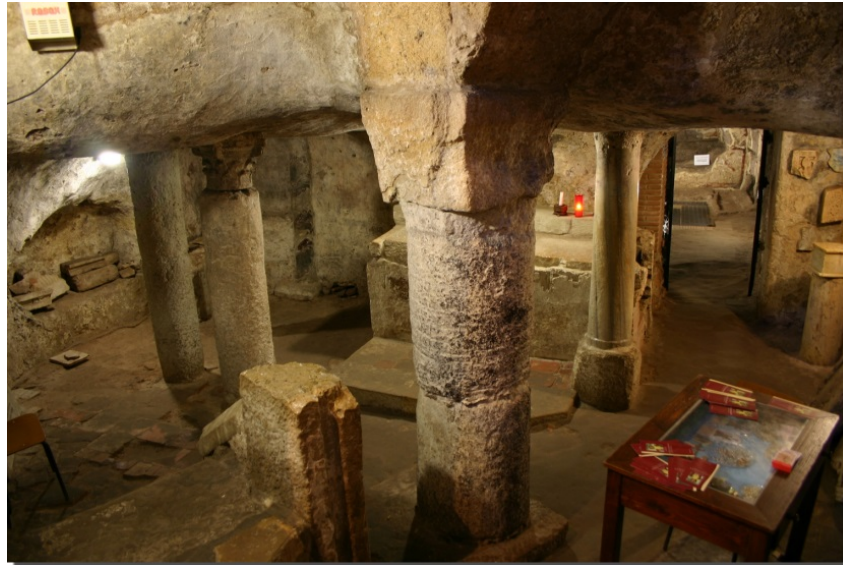
Fig. 2 - Entrada a la catacumba con el sarcófago-altar de Sant'Antioco

El hipogeo A+B+L es al que más modificaciones se le han realizado. En cambio, el D conserva sus originales características púnicas: el vestíbulo, las dos celdas y el acceso que baja hasta el sureste; el hipogeo E también presenta el esquema clásico de las cámaras funerarias púnicas, a parte de los retoques de las paredes para la abertura de nichos y arcosolios: la cámara se encuentra en un estado de conservación bastante degradado (fig. 3).