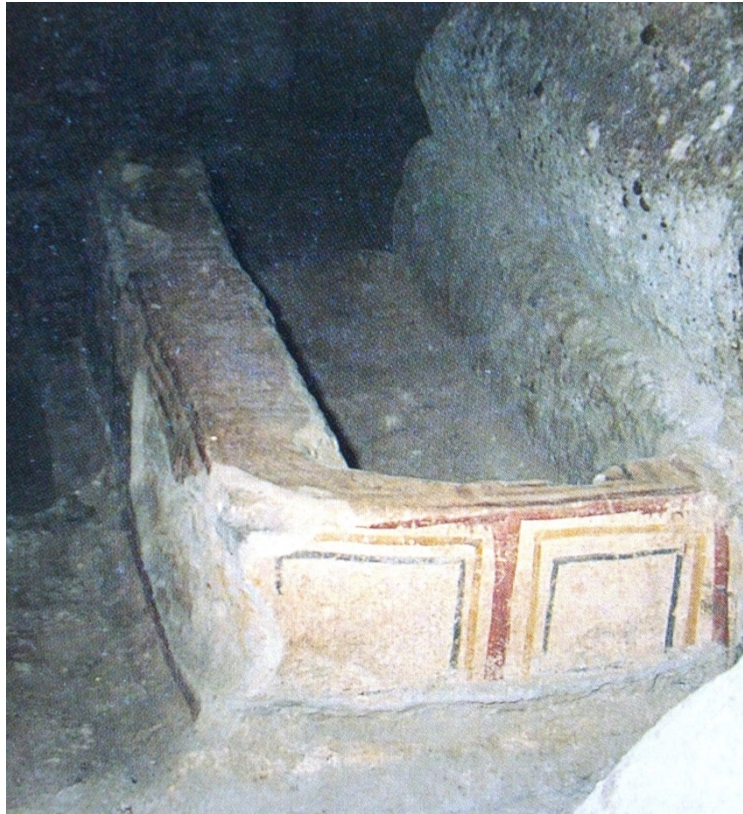
Fig. 4 - Sarcófago pintado en el ambiente E (de Porru 1989, lám. XXII c)

El hipogeo F se agrandó para que pudiera albergar una celda más profunda respecto a la púnica preexistente. Por último, el hipogeo G tiene una forma bastante irregular respecto al plano original: los sepultureros trabajaban de una forma más radical, demolían los tabiques originales y abrían una celda nueva para aumentar la capacidad de la cámara que acoge una tumba particular con baldaquín (fig. 5). En el interior de los ambientes de la catacumba de Sant'Antioco hay varios tipos de sepulcros: de fosa, con arcosolio, de enchytrismòs , con un espacio simple, con sarcófago, con caja y, por último, la denominada tumba con baldaquín.