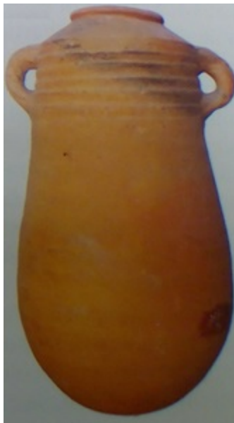
Fig. 1- Ánfora púnica de origen cartaginés que usaban como osario. Museo arqueológico "F. Barreca" (de Bartoloni 2007, pág. 91, fig. 60).

El ritual de la incineración se practicó en Sulky en la era púnica, entre los siglos III y II a.C. No se trataba de restaurar el ritual de la era fenicia (sig. VIII-VI a.C.), sino del resultado de la difusión de la cultura helenística, es decir, un ritual funerario griego, en el panorama de una koinè que surgió de las hazañas de Alejandro Magno en Oriente y que, en Cerdeña, se registró a partir de la conquista romana de la isla, en el año 238 a. C. En estos casos a menudo se usaban, como osarios, unos recipientes que anteriormente usaban en el ámbito doméstico, como pequeñas jarras, urnas, ánforas (fig. 1), al lado de los cuales solían colocar un cipo o una gran piedra como sema .