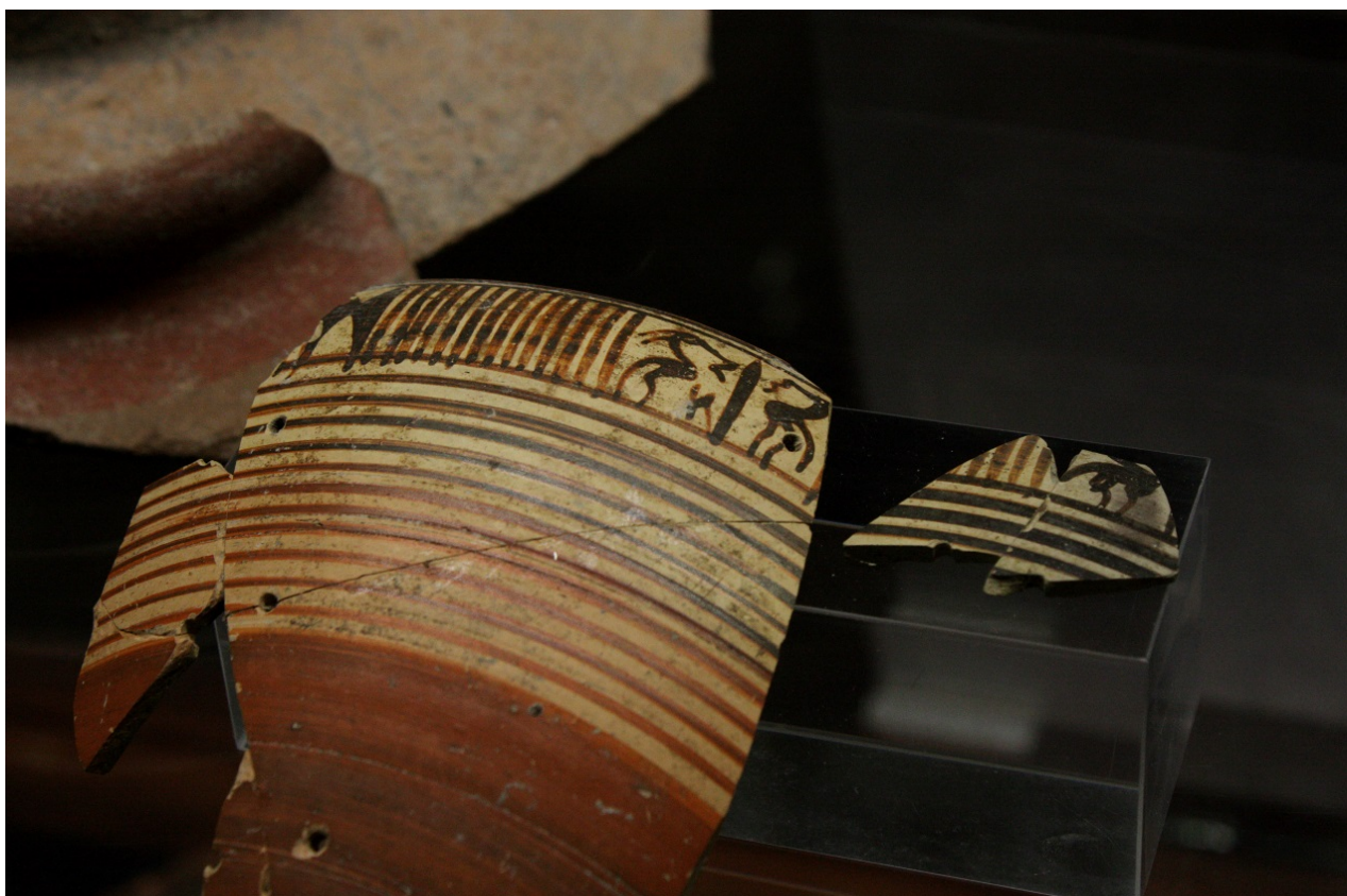
Fig. 2 - Fragmento de cerámica greco-eubóica expuesto en el Museo arqueológico "F. Barreca".