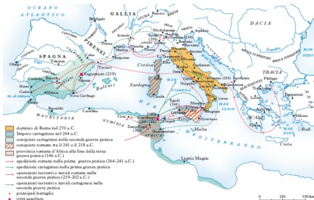
Fig. 4 - Expansión romana en el Mediterráneo entre los siglos III y II a.C..

cartagineses. En Cerdeña también fortificaron las ciudades de Karalis, Nora, Monte Sirai, Neapolis, Othoca, Tharros y Olbia, además de algunos asentamientos extraurbanos, que se han interpretado como campamentos militares, como Santu Antine di Genoni y San Simeone di Bonorva, entre otros. En las áreas de la localidad que estaban demasiado lejos como para incluirlas en el área urbana, como el tofet, construyeron fortificaciones específicas. A partir de aquí comenzó un nuevo período floreciente para Sulky . Con la Primera Guerra Púnica (264-241 a.C.), la ciudad pasó a formar parte del conflicto y albergó a contingentes militares compuestos por mercenarios. Tras la guerra, en la que Sicilia pasó bajo el dominio romano. Cartago tuvo que hacer frente a las revueltas provocadas por las tropas de los mercenarios, tanto en el norte de África como en Cerdeña, y tuvo que luchar contra ellas incluso en su tierra. Cosechó la victoria, pero a un precio muy alto: sus propios mercenarios. De hecho, Cartago estuvo forzada a abandonar su dominio en Cerdeña. A partir del año 238, comenzó el dominio romano sobre una Cerdeña que ya había sido fuertemente influenciada por los púnicos (fig. 4).