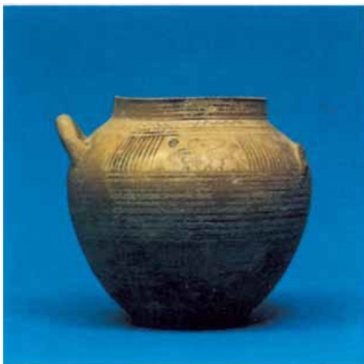
Fig. 3 - Olla de producción greco-eubóica de Pithecusas (730-710 a.C.) (de Tronchetti 1989, p. 8, fig.1).