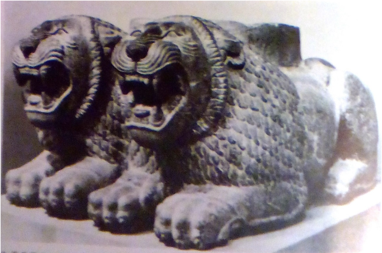
Fig. 8 - Base de una columna con forma de leones tumbados, de Tell Tainat (de Bittel 1997, pág. 245, fig. 277).

Es difícil atribuirles a los leones una fecha exacta. De conformidad con los elementos estilísticos que se han mencionado, algunos expertos indican que podrían pertenecer a finales del siglo VI a.C., mientras que otros afirman que las estatuas son de la misma época de la construcción de las murallas urbanas, por lo tanto, pertenecerían a la primera mitad del siglo IV a.C.