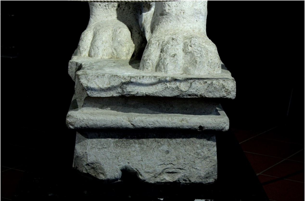
Fig. 4 - Detalle de la base de uno de los leones de Sulci.

Las estatuas se pueden enmarcar desde el punto de vista arquitectónico gracias a tres elementos relacionados entre sí: una base con acanaladura egipcia; un arquitrabe rectangular que en un lado parece como si se fundiera con las cabezas de los felinos y del otro termina en un pilar rectangular y con forma que hace de unión entre la base y el arquitrabe, pegándose a la parte posterior de las estatuas. La altura de las esculturas es de aproximadamente 156 cm (figs. 3-4).