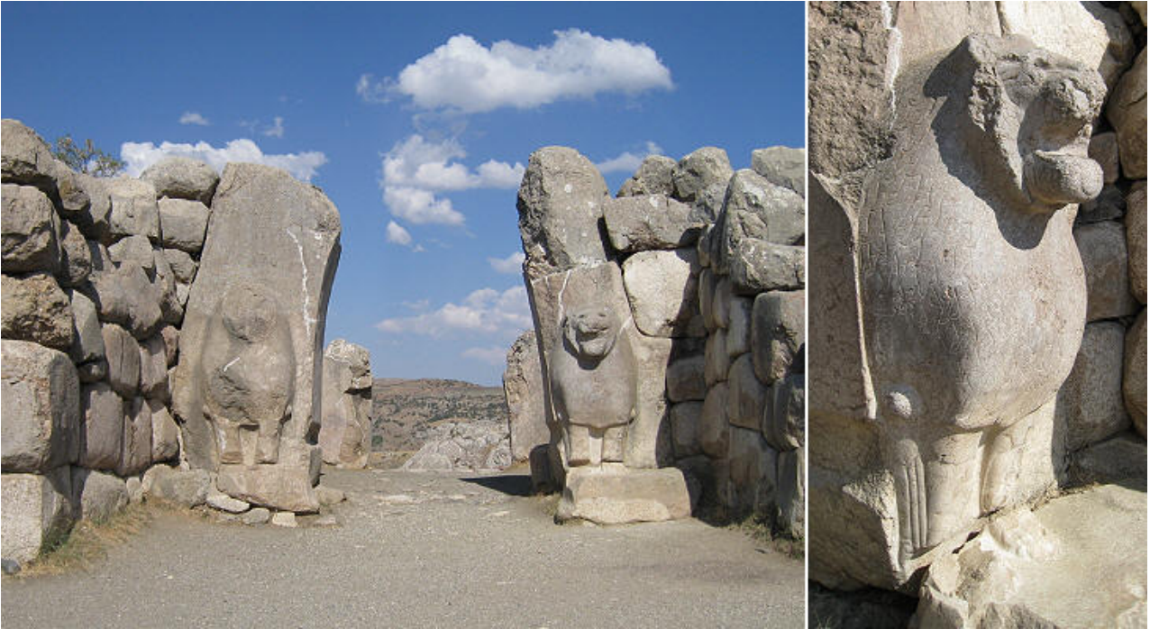
Fig. 6 - La puerta de los leones de Hattuša de Anatolia.

iconos de la esfinge, que se pueden hallar en detalles específicos como la cola enrollada sobre un muslo. Se trata de la misma flexión de los leones de Sulci y que los convertiría en el resultado de una fusión de elementos estilísticos e iconográficos, conocidos también en la Grecia arcaica y en Etruria.