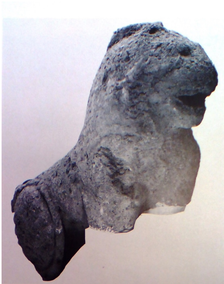
Fig. 5 - León de Tharros (de Moscati 1980, pág. 172, fig. 2).

arquitectónicos similares a los de los leones de Sulci pero, en este caso, son menos respecto al conjunto de la figura del animal.