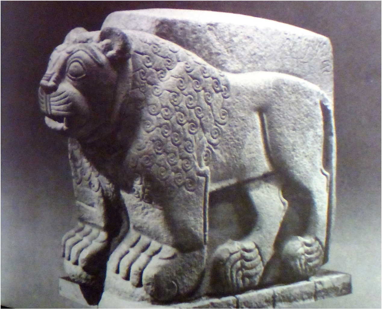
Fig. 7 - León de Arslantepe (Malatya), en Anatolia (de Bittel 1997, pág. 269, fig. 307).