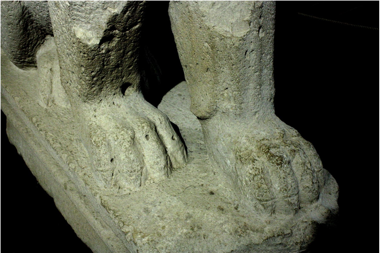
Fig. 2 - Detalle de las patas de los leones con las garras en evidencia.

La voluminosa cabeza cuadrada se suaviza con la melena, que la enmarca por completo, y que fue creada con grandes mechones «a fiamma», mientras que la robusta musculatura está estilizada con incisiones (fig. 3).