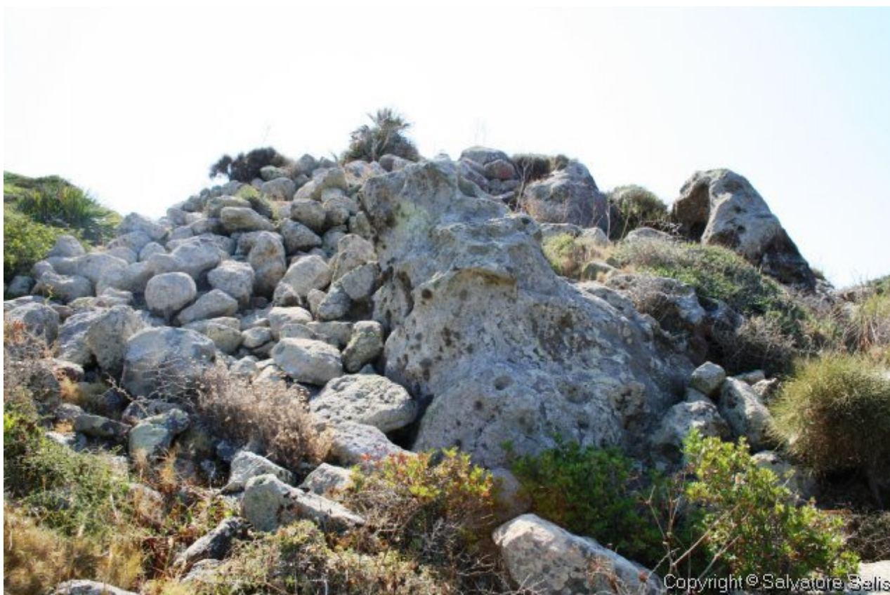
Fig. 4 - Restos del nuraga Grutti Acqua