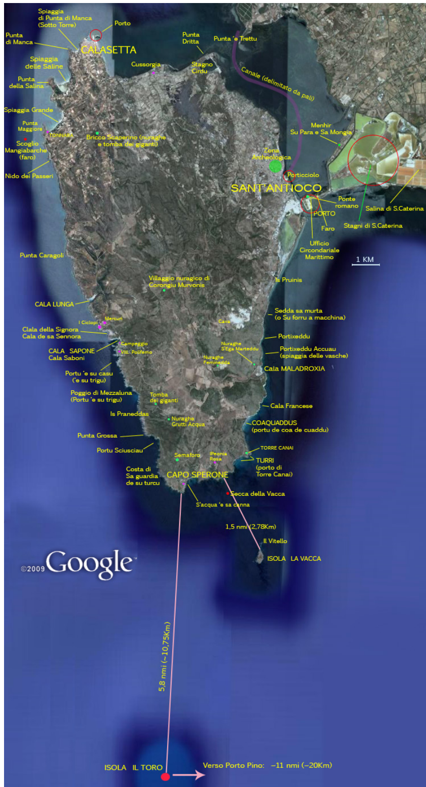
Fig. 3 - Mapa con la indicación de varios topónimos y nuragas presentes en el territorio