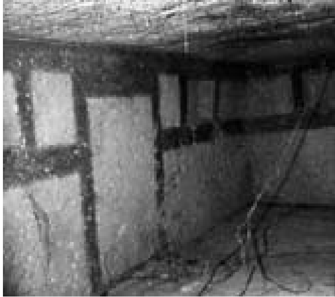
Fig. 5 - Detalle de la puerta decorativa de la tumba 7 (de Bernardini 2007, pág. 157, fig. 10).