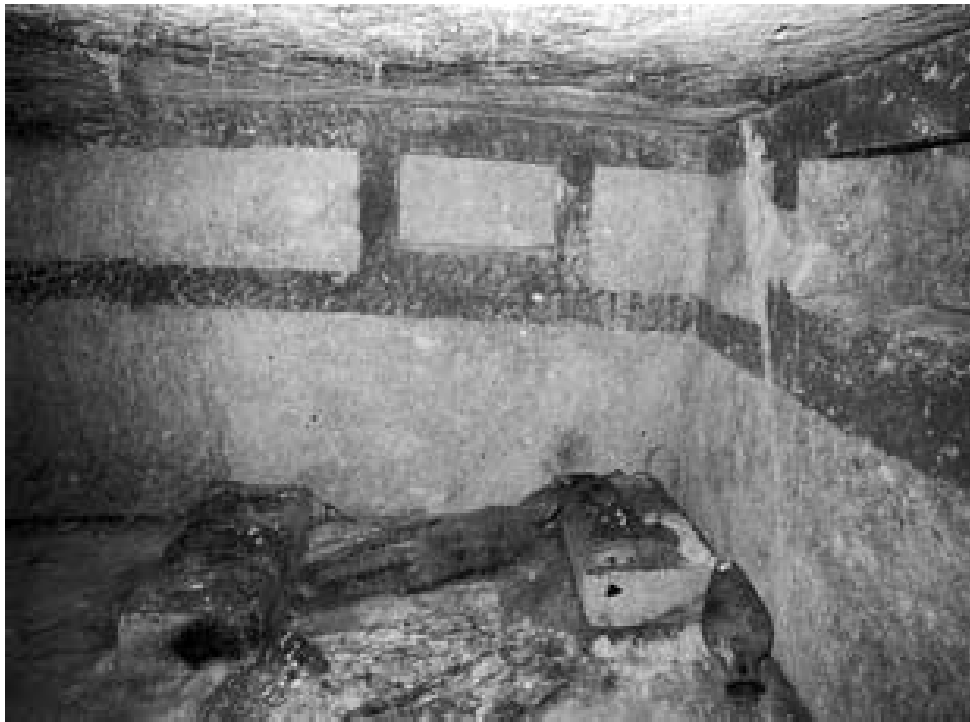
Fig. 4 - Detalle de la decoración con pintura del lado derecho del hipogeo 7 y en la pared del fondo (de Bernardini 2007, pág. 156, fig. 9).

Las paredes de la cámara a menudo contenían nichos, dentro de los cuales colocaban jarrones como parte del ajuar. En algunos casos estaban decorados con pintura (directamente en la roca), como en la cámara sepulcral de la tumba 7 (fig. 3) donde unas simples franjas horizontales de color rojo diseñan horizontalmente el perfil de ocho nichos (dos para cada pared) y una puerta decorativa. Las caras laterales y la posterior del pilar están enmarcadas por franjas rojas (figs. 4 y 5).