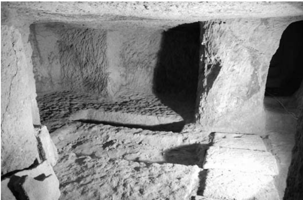
Fig. 2 - Interior de la Tumba Steri 2, donde se han hallado dos fosas (en Muscuso, Pompianu 2010, pág. 2040, fig. 7).

El pasillo y el altillo llevan al acceso de la cámara sepulcral que, cuando fue saqueada, contaba todavía con el cierre original formado por una losa que consiguieron durante la excavación de la tumba (véase la fig. 1), que sellaron con arcilla fresca. La cámara la solían cerrar con piedras o ladrillos de arcilla que secaban al sol. La cámara sepulcral siempre tiene forma cuadrangular irregular, mientras que las tumbas más antiguas cuentan con una celda sencilla de un tamaño promedio de 4x5 metros, sin ninguna separación y con la entrada en el lado más corto. Las más recientes suelen contar con un tabique cuya cara hacia la entrada suele estar decorada con elementos geométricos o figurativos, sencillos o complejos, como en el caso de los altorrelieves de figura humana completa, de tamaño natural, de estilo egiptizante y que, generalmente representaban al dios Baal Addir, el señor del más allá (tumba 7). Las cámaras sepulcrales nunca siguen un estándar exacto. De hecho, presentan varios tipos de adaptaciones en la roca en la que están excavadas y algunas incluyen en su interior sepulturas de fosa, como en el caso de la Tumba Steri (fig. 2).