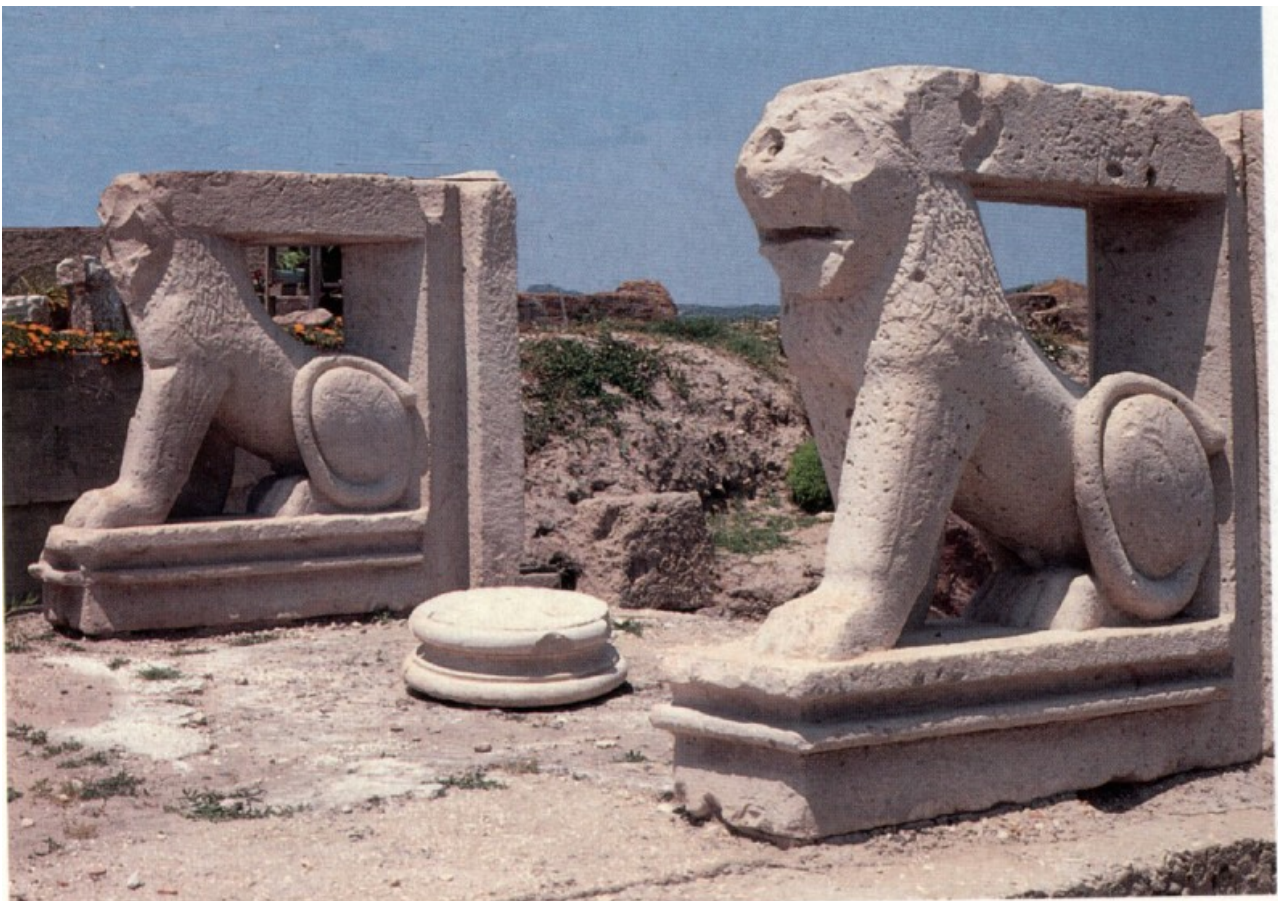
Fig. 6 - Los leones de Sulci en el museo arqueológico F. Barreca tras su descubrimiento.

Durante las nuevas investigaciones hallaron unas estatuas de dos leones tumbados y esculpidos detalladamente. Se supone que dichas estatuas hacían guardia en la puerta de un centro púnico, o que incluso pertenecieron a una fábrica de monumentos sagrados que posteriormente pudieron haber usado como adornos en el anfiteatro romano (fig. 6).