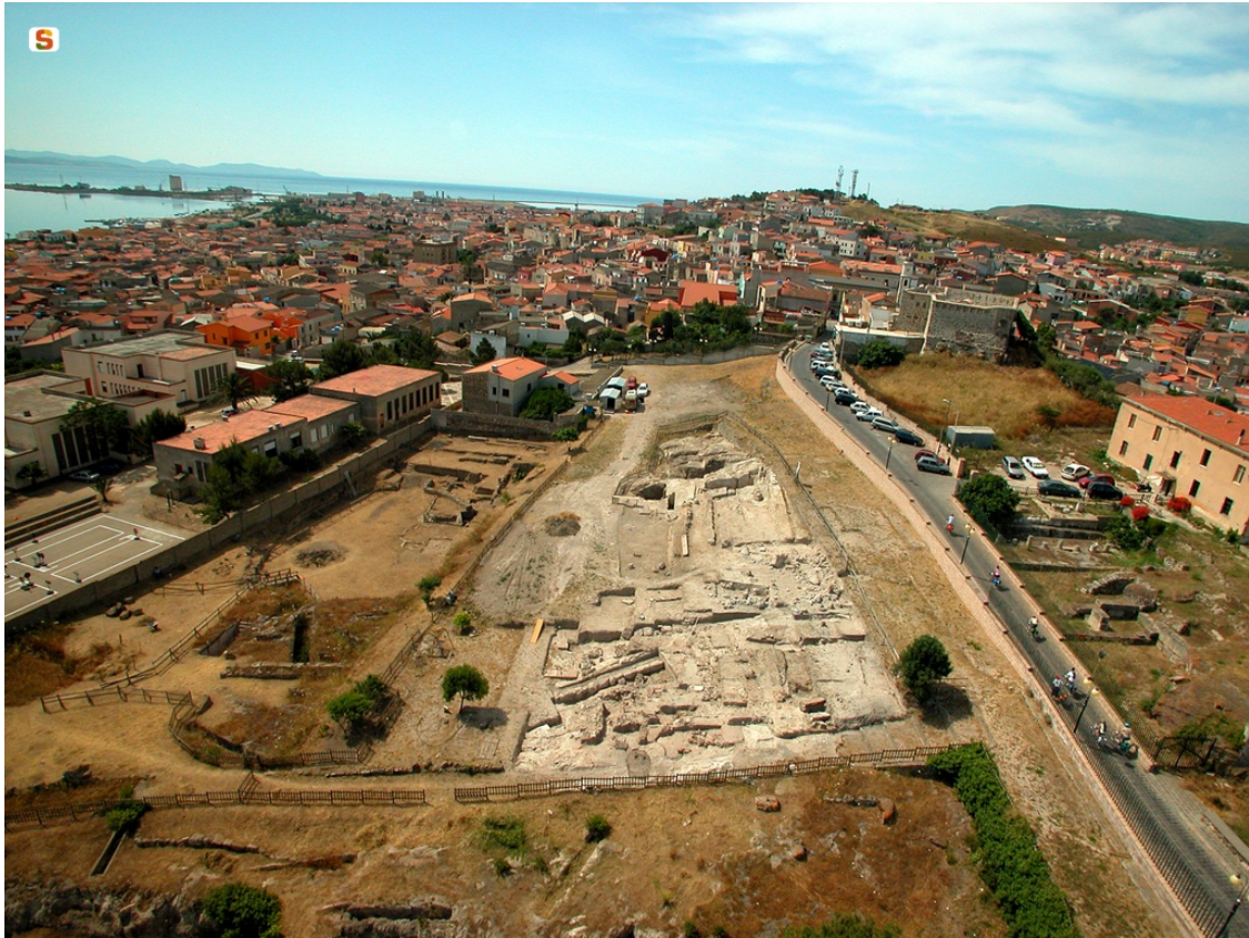
Fig. 3 – Vista de la necrópolis de Is Pirixeddus desde el sur.

Algún tiempo después de las actividades del canónigo G. Spano, Antonio Taramelli describió el hallazgo de dos hipogeos en la iglesia parroquial durante las excavaciones de junio de 1906. En los años sucesivos, las excavaciones se concentraron en las catacumbas debajo de la misma parroquia, construidas en la época paleocristiana reutilizando y readaptando los sepulcros púnicos (figs. 4-5). En 1942, Salvatore Puglisi publicó los resultados de la excavación realizada en los tres hipogeos púnicos intactos de la calle Belvedere, aproximadamente a 200 metros hacia el sureste de la basílica. Posteriormente, las investigaciones continuaron de la mano de Gennaro Pesce: en 1954 descubrieron el primer hipogeo en el lado oriental de la colina de Mont'e Crescia, en la localidad de Is Pirixeddus, que también reutilizaron en la época paleocristiana y que era conocido como la "Tumba del fresco". Posteriormente, dicha área fue el centro de las investigaciones durante 50 años ininterrumpidos. Dichas investigaciones tuvieron un impulso adicional por parte de la Superintendencia de las provincias de Cagliari y Oristano, gracias a las