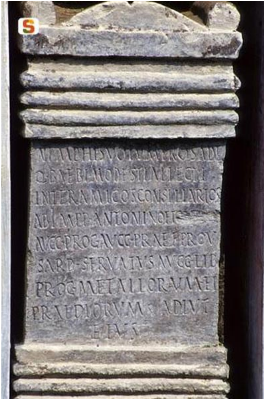
Fig. 1 - Inscripción del Ninfeo.

El cipo (fig. 1) fue hallado en su ubicación original (figs. 2-4) dentro de un nicho del Ninfeo al lado de la gran natatio (fig. 5).