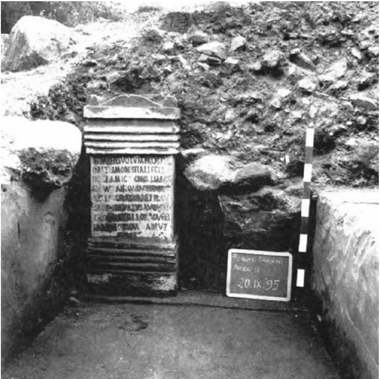
Fig. 3 - La inscripción del Ninfeo en el momento de su hallazgo (de Bacco, Serra 1998, lám. XIX).