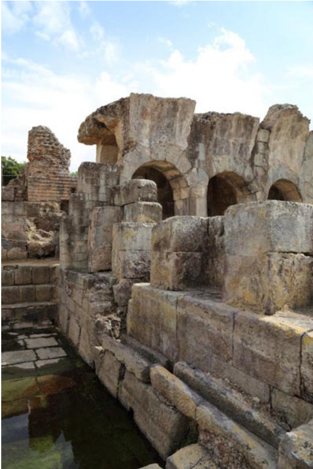
Fig. 5 - El Ninfeo al lado de la natatio.