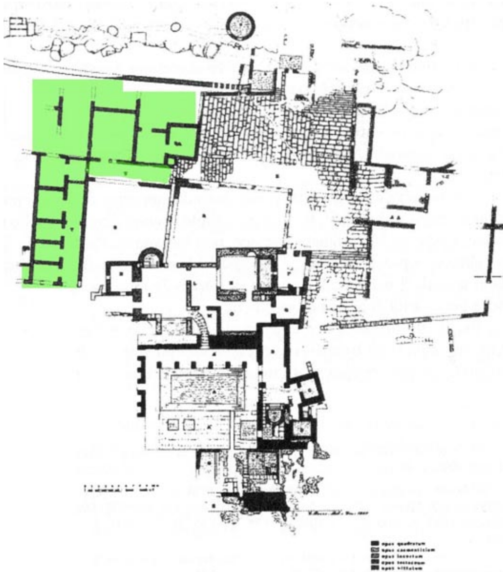
Fig. 1 - En color verde se indica el edificio con forma de L (de Bacco-Serra 1998, reelaborado por C. Tronchetti).

Hacia el sureste de las Termas se ha descubierto un edificio con forma de L (fig. 1), cuyos pasillos delimitan el denominado «gimnasio».