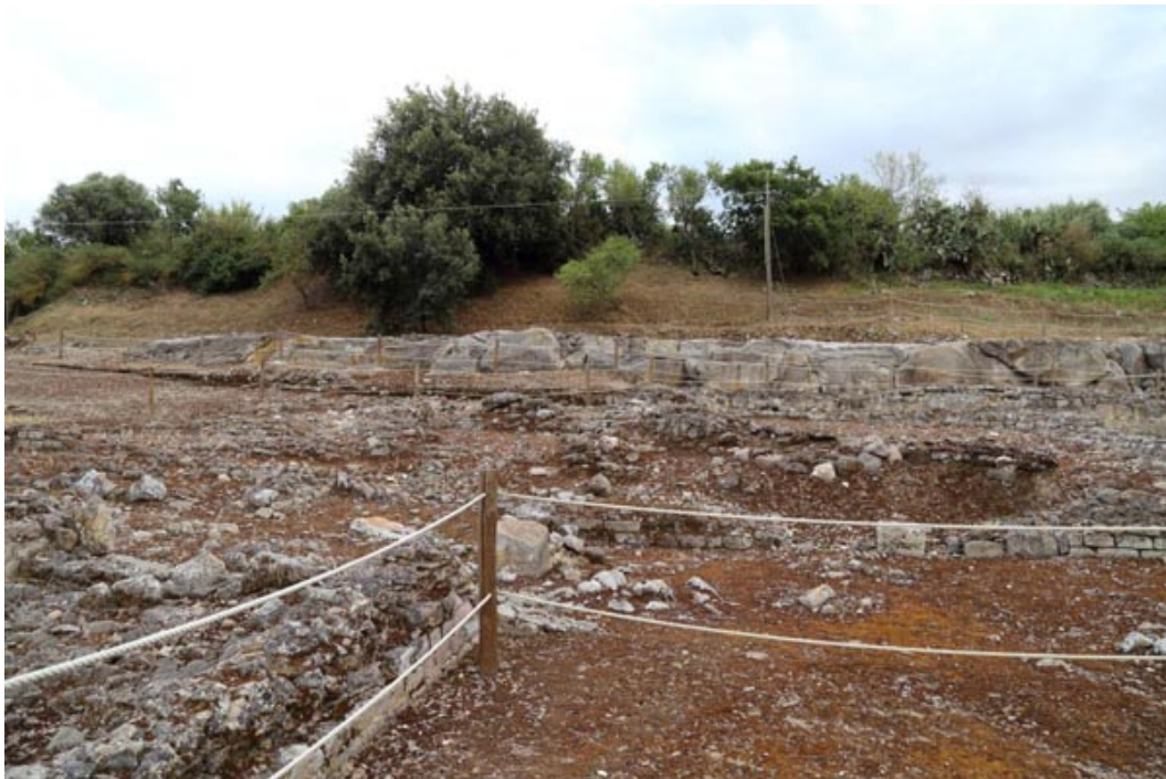
Fig. 3 - Edificio con forma de L: restos que probablemente pertenecen a una vivienda

En cambio, en el lado sur, los ambientes tienen una estructura más compleja (figs. 3 y 4).