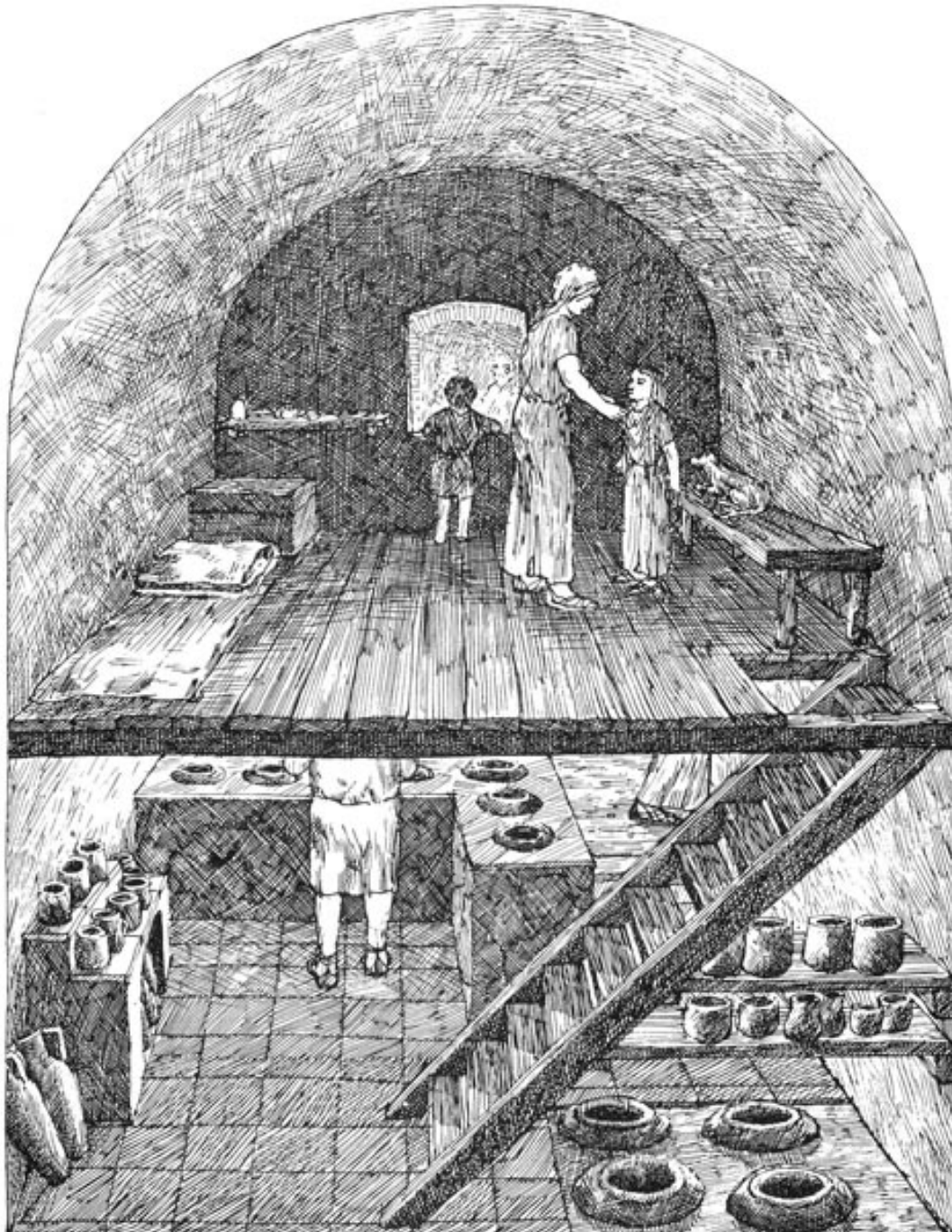
Fig. 5 - Reconstrucción de una casa-taller romana: el piso inferior se destinaba al comercio, mientras que el superior a la vivienda (de Macaulay 1978, pág. 107).