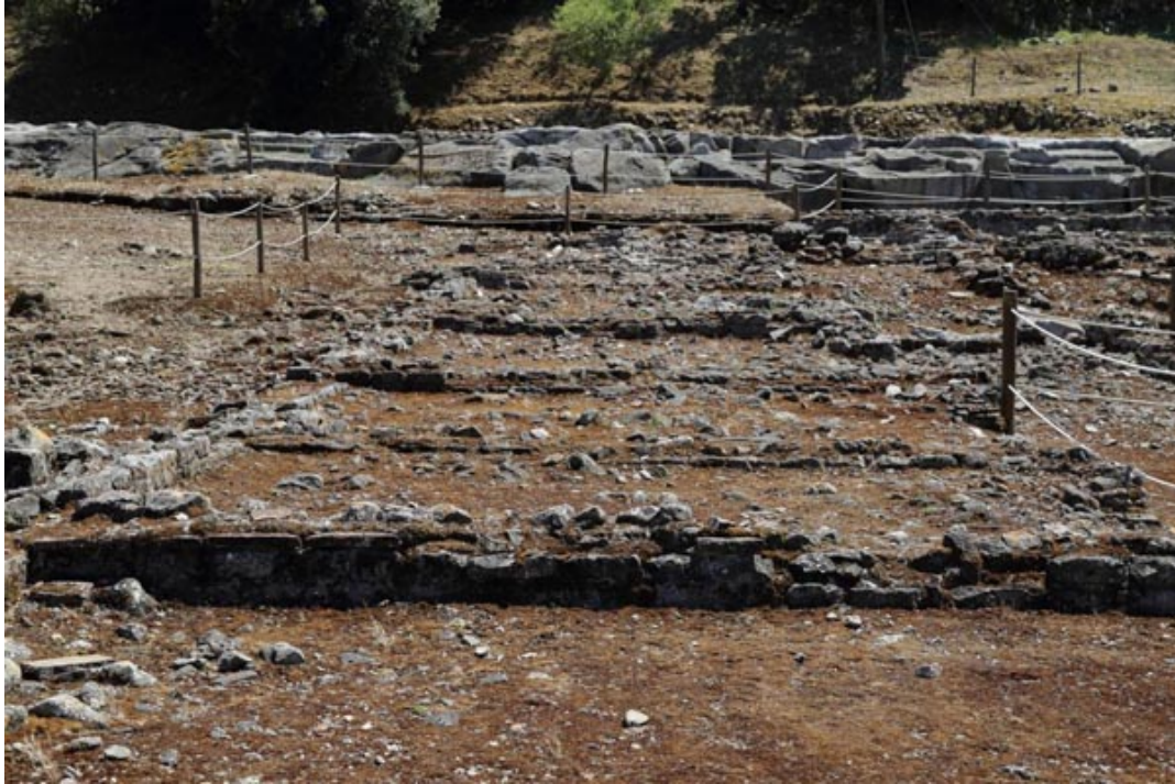
Fig. 2 - Edificio con forma de L: los ambientes alineados a un pasillo.

En cambio, en el lado sur, los ambientes tienen una estructura más compleja (figs. 3 y 4).