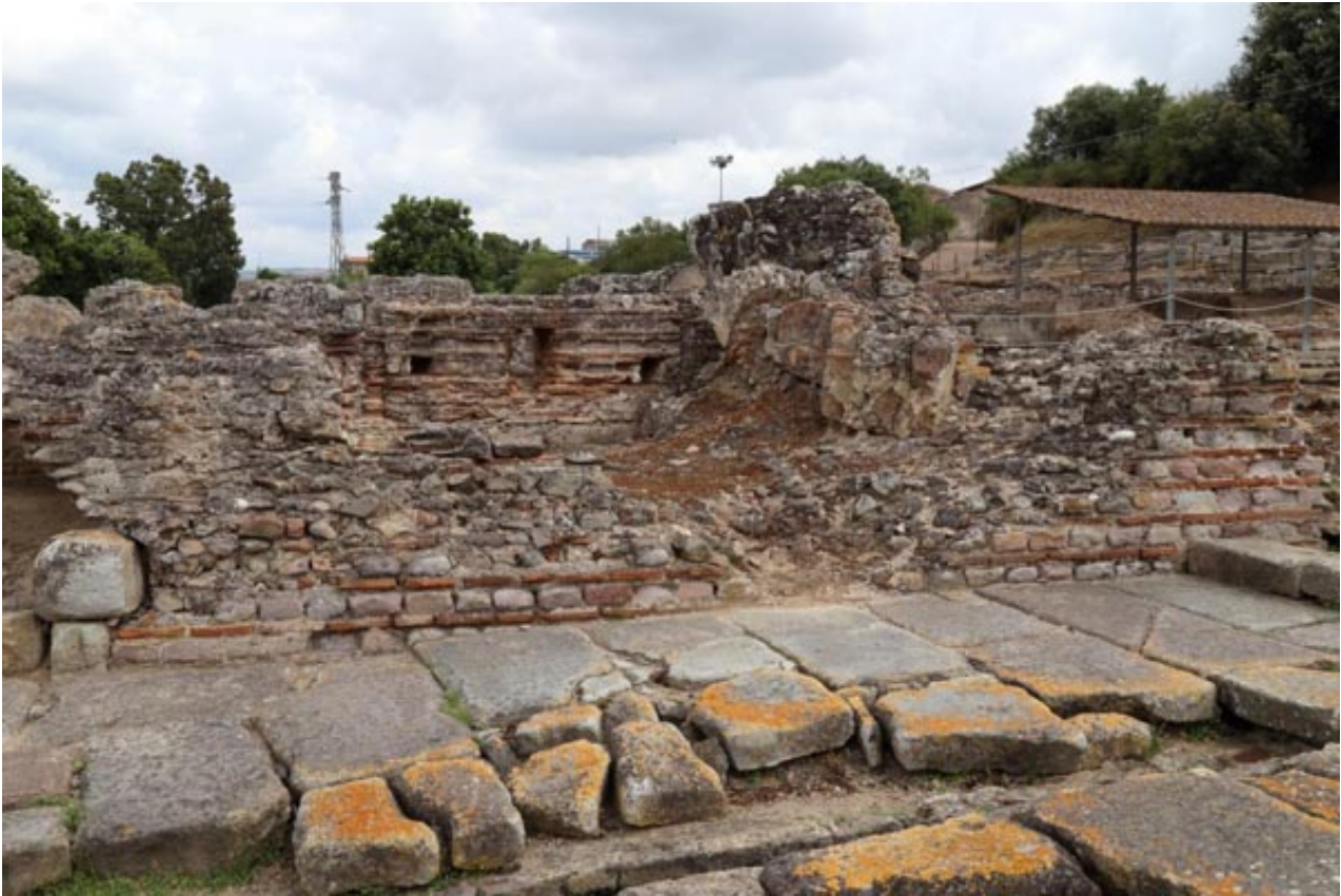
Fig. 4 - Edificio con forma de L: vivienda vista desde la plaza

No se ha podido identificar con seguridad la función de estas estructuras y se ha hipotetizado que una parte se usó como alojamiento para las visitas de las Termas, aunque no hay pruebas al respecto. Lo que sí es seguro es que el sector sur estuvo compuesto por estructuras residenciales de las que no quedan los pisos superiores y que se han podido reconstruir según los datos de otros lugares que se conservan en mejor estado, como Pompeya y Ostia (figs. 5 y 6).