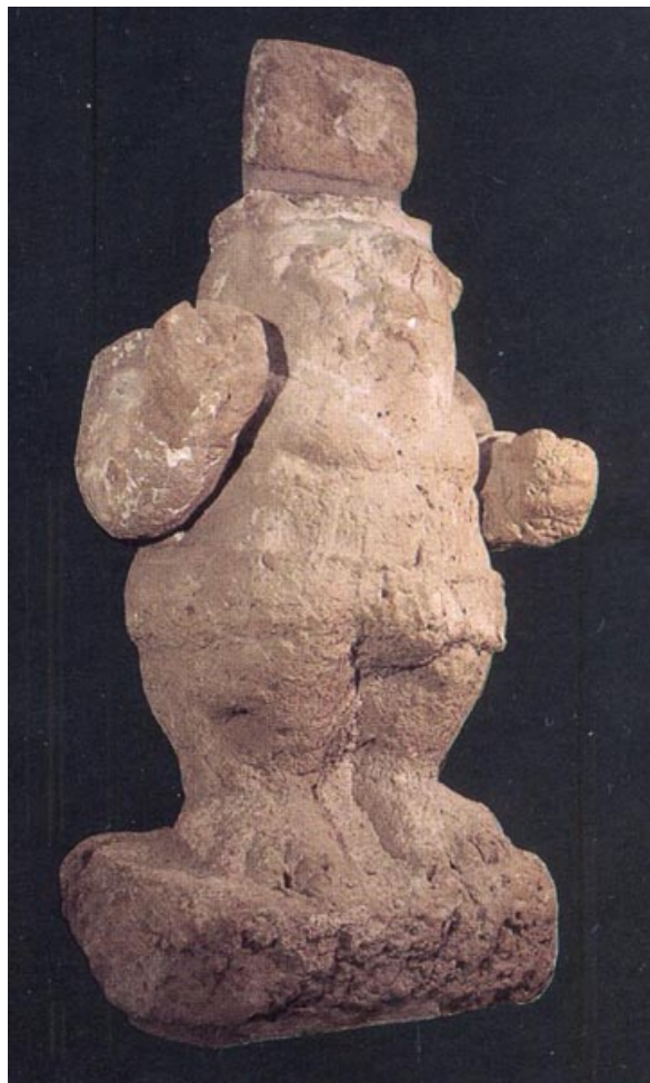
Fig. 1 - Estatua de Bes de Bithia, vinculada a un culto de sanatio . (de Barreca 1986, pág. 137)

El culto de las Ninfas de Fordongianus, vinculado con las aguas, también estuvo caracterizado por la salud debido a las propiedades curativas de las fuentes termales. La presencia de inscripciones dedicadas a las Ninfas y a Esculapio, dios de la salud, corrobora esta interpretación. De esta forma podemos colocar a Fordongianus entre las localidades sardas vinculadas con los cultos de sanatio , es decir, de la salud, que ya se verificó en la era púnica tardía y republicana, entre los siglos III y II a.C. Quizás estuvieron vinculadas con los ámbitos termales, como Mitza Salamu di Dolianova, o incluso influenciadas por un contexto curativo y las convirtieron en lugares de culto dedicados al dios Bes/Esculapio, como en Bithia (fig. 1) y Nora (fig. 2).