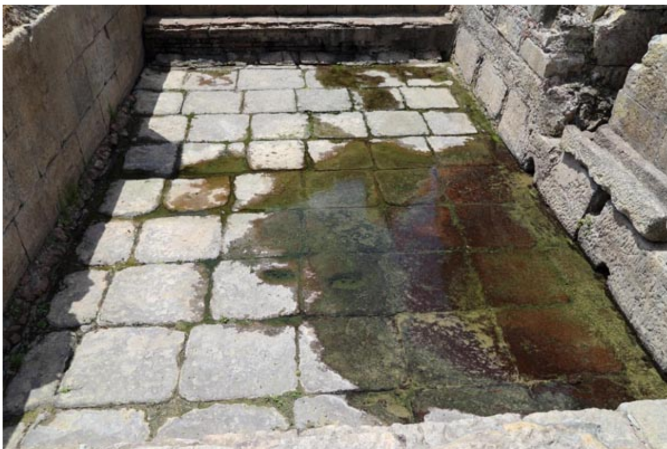
Fig. 2 - El Ninfeo visto desde el norte

El espacio cuenta con una piscina rectangular con escalones en los lados más cortos, decorada por cinco nichos rectangulares en el lado oeste y siete en el este. En uno de los nichos del lado este se ha hallado una inscripción que nos permite hipotetizar que el resto de nichos tuvieron también otras inscripciones, es decir, obras escultóricas que no han durado hasta la actualidad.