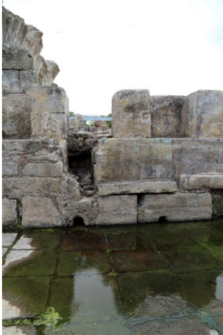
Fig. 4 - Vista de la pared del lado oeste del Ninfeo, con la abducción del agua. En el fondo de la pared se notan los orificios para la descarga de las aguas residuales.

Las aguas fluían en el lado corto del sur mediante dos bocas, y en el lado oeste a través de una abertura (fig. 4). Por su parte, en el lado norte una canaleta dirigía las aguas sucias hacia el río (fig. 5).