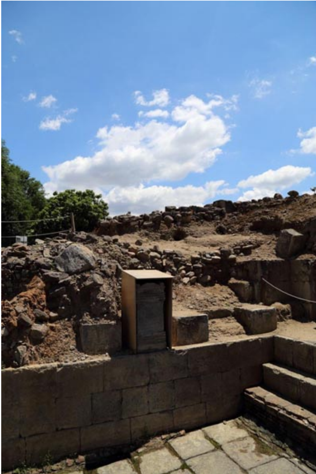
Fig. 3 - Vista del Ninfeo con la inscripción reubicada y protegida.