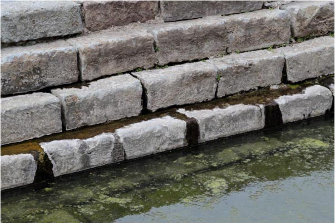
Fig. 5 - Las inscripciones que reutilizaron para arreglar los escalones de la natatio en la antigüedad tardía.