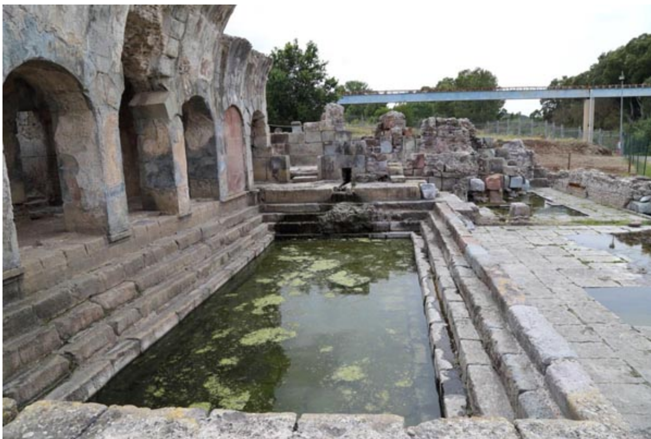
Fig. 2 - La natatio vista desde el lado este.

La piscina cuenta con cuatro escalones en los lados norte, oeste y sur, mientras que en el lado este dispone de cinco. En la parte alta del lado oeste se encuentra el flujo de las aguas calientes y frías mezcladas que, en una época, fluían de una boca con forma de prótomo de animal, que hoy en día ya no está (fig. 3).