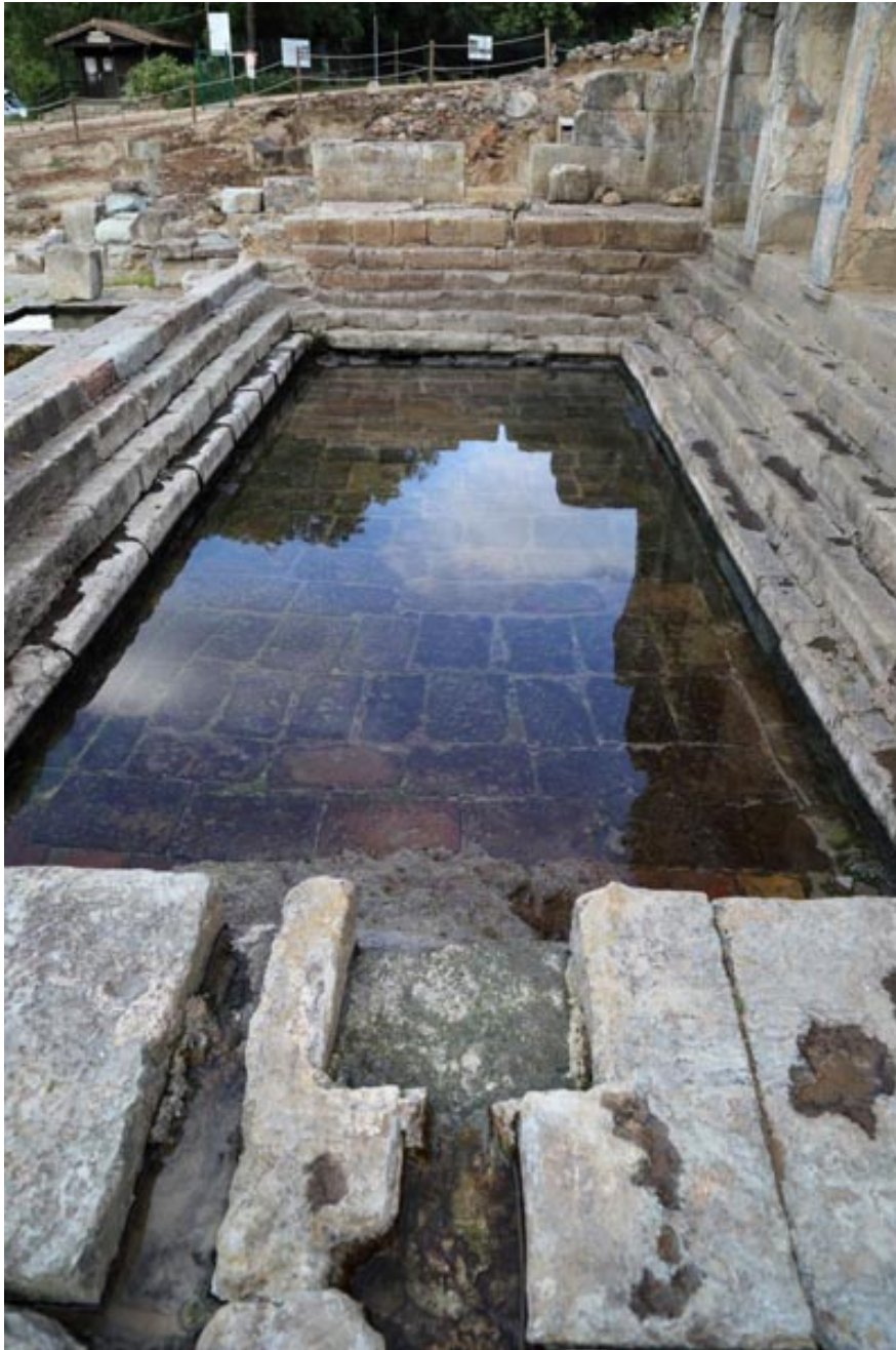
Fig. 3 - Vista de la natatio con el punto de aducción del agua.

En el lado oeste se encontraban algunos cuartos de servicio y las bañeras donde se mezclaba el agua (fig. 4).