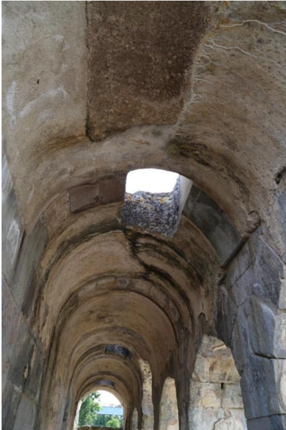
Fig. 5 - Cubierta del porticado con los tragaluces a través de los cuales pasaba la luz para iluminar el espacio.