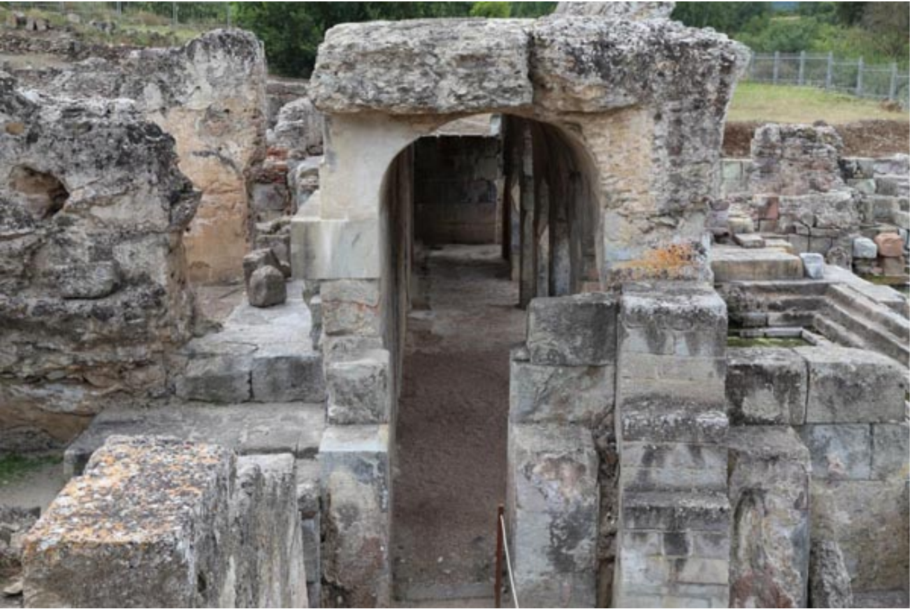
Fig. 4 - Vista del porticado del lado este.