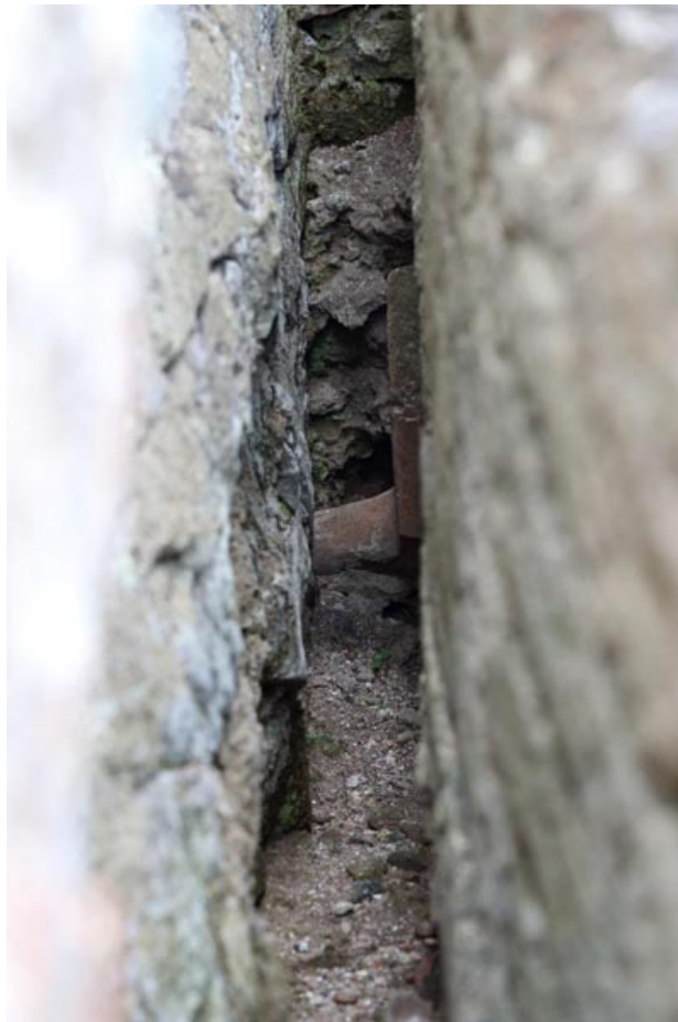
Fig. 3 - Detalle de la abertura entre la bañera y la pared por donde pasaba el aire caliente.