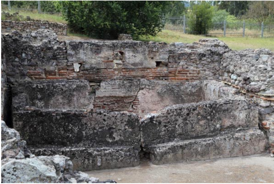
Fig. 2 - Bañera del calidarium.