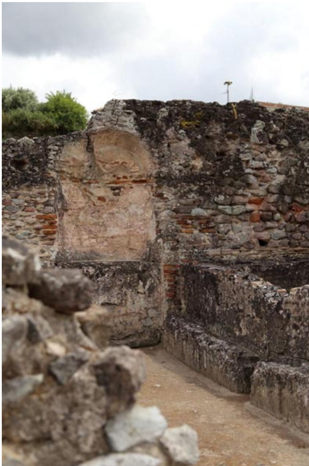
Fig. 4 - Vista parcial del calidarium con la bañera y el nicho.

En la pared de al lado se observa un nicho que habría contenido una estatua decorativa y que hoy en día está perdida (figuras 4-5).