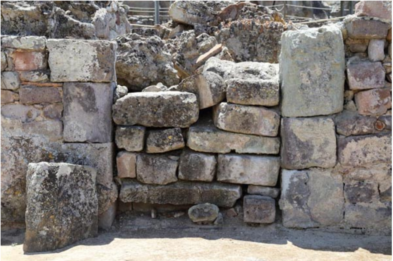
Fig. 2 - Entrada a las termas desde el patio

Este ambiente, cuyo tamaño y modesto grosor de los cimientos hacen pensar que estaba abierto, ha sido reconocido como un patio de acceso a las Termas dado que se abre una gran entrada hacia el frigidarium (fig. 2), y, al mismo tiempo, hace las veces de lugar de paso hacia otro espacio abierto opuesto en el lado este (fig. 1, en azul).