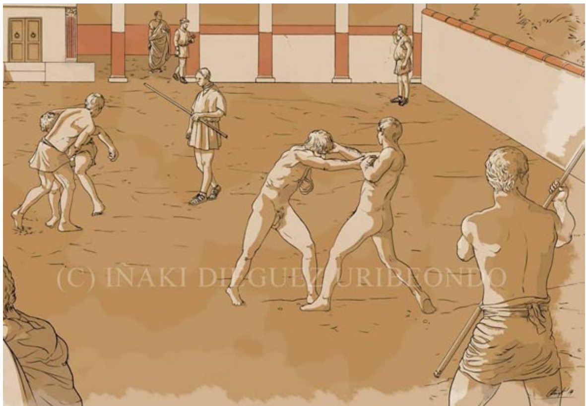
Fig. 4 - Reconstrucción del gimnasio de las Termas romanas de Sebastium , en Vitoria Gasteiz, España (de Facebook "IDU. Ilustración y Dibujo arqueológico", ilustración de Iñaki Diéguez Uribeondo).