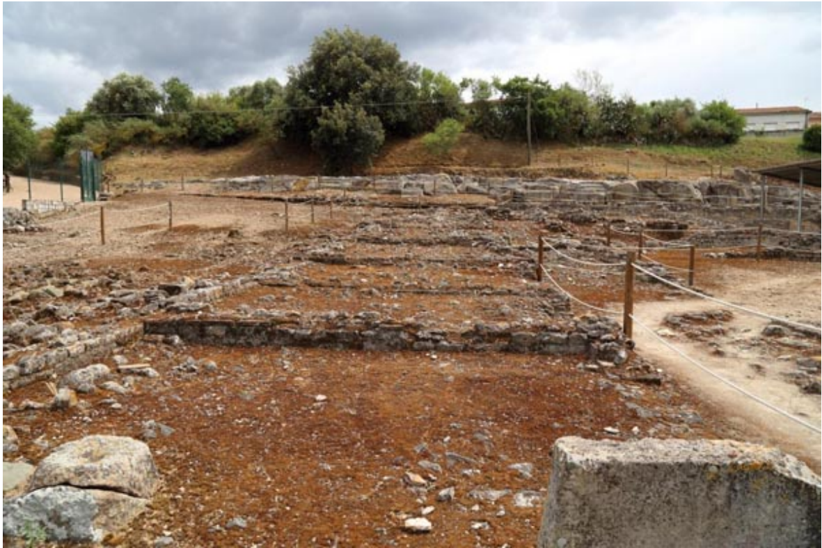
Fig. 3 - Vista de los ambientes adyacentes al gimnasio