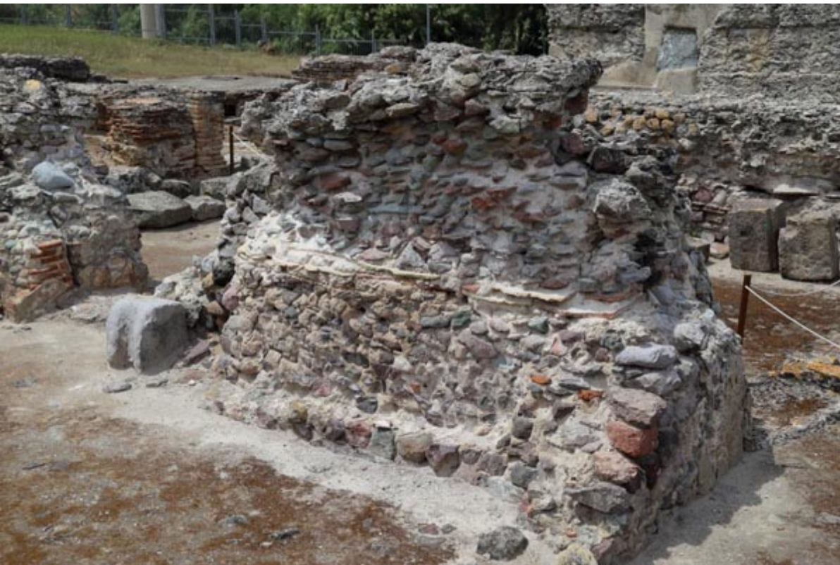
Fig. 4 - Pared del tepidarium con signos evidentes de la fuerte erosión que ha revelado la estructura del interior.