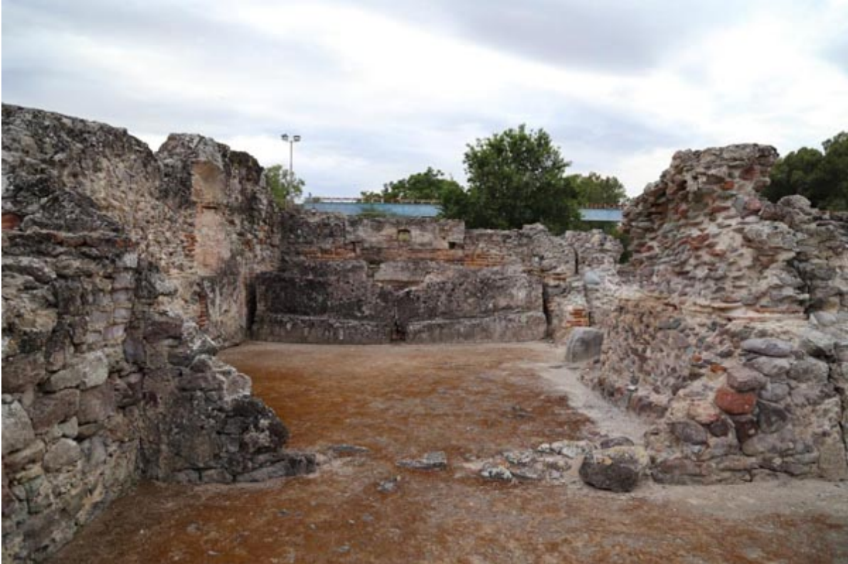
Fig. 3 - Paso del tepidarium al calidarium.