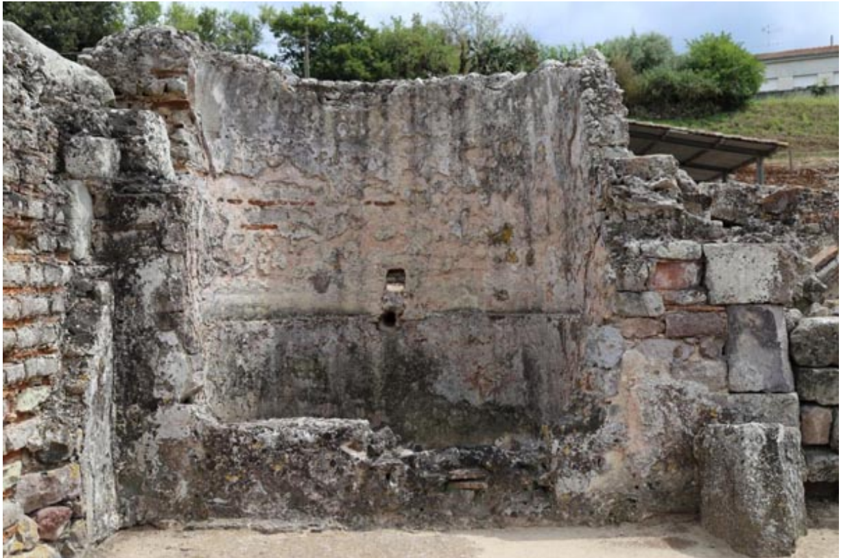
Fig. 3 - Bañera de inmersión semicircular.