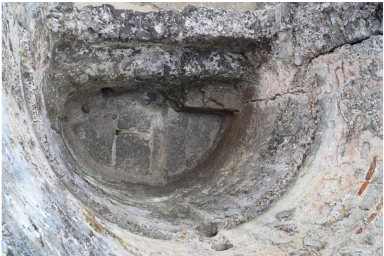
Fig. 4 - Detalle de la bañera con las escaleras de acceso.