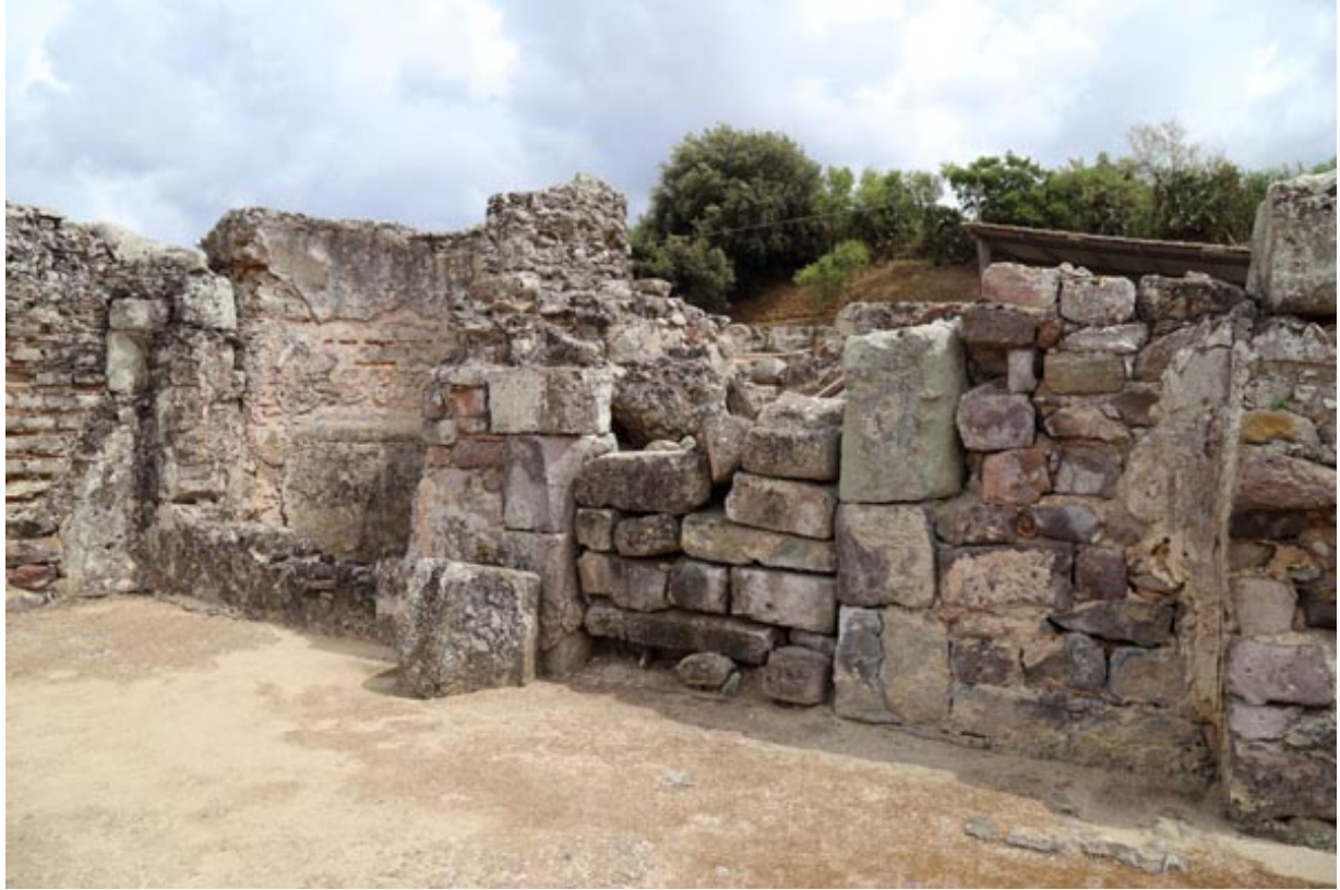
Fig. 2 - Entrada al frigidarium.

ambiente de entrada, como lo indica la gran puerta que obstruyeron en la antigüedad tardía (fig. 2). En este espacio hay dos bañeras: una rectangular y la otra semicircular (figs. 2-4), ambas de un tamaño reducido.