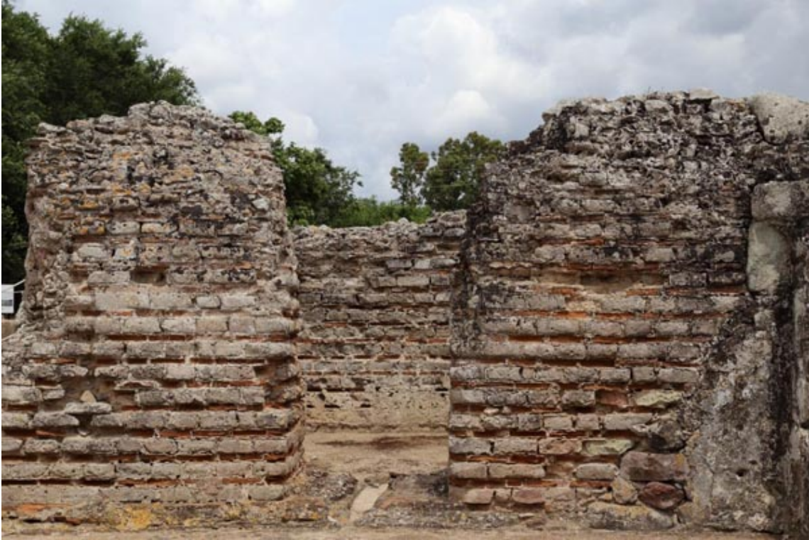
Fig. 2 - Paso del frigidarium a un espacio con una función incierta, que probablemente fue un vestuario.