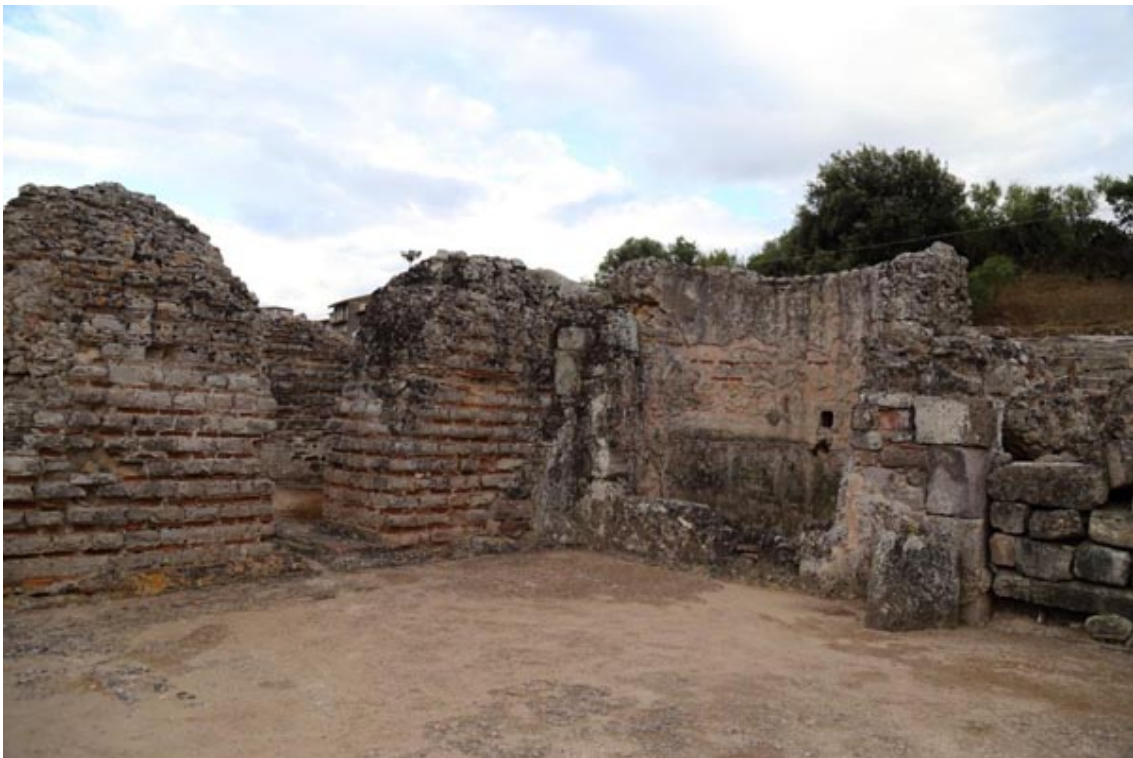
Fig. 3 - Detalle del frigidarium de las Terme II, con una bañera absidal.