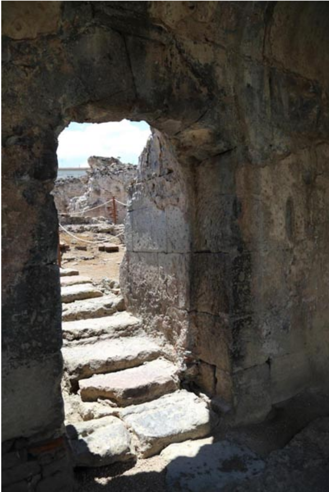
Fig. 6 - Escalera de la antigüedad tardía que permitía pasar de las Termas II a la natatio de las Termas I.