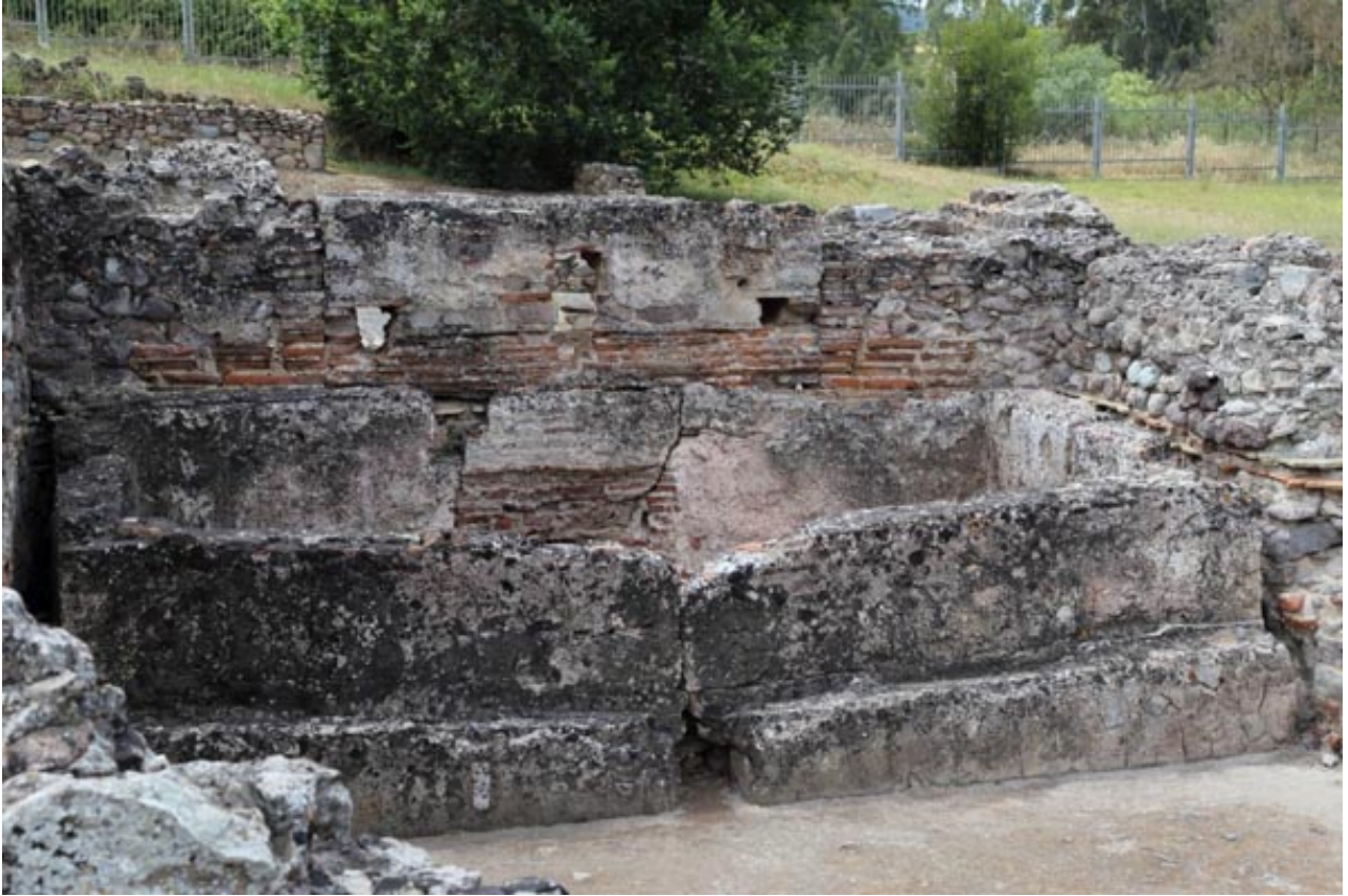
Fig. 5 - Bañera del calidarium.

Muy probablemente también se podía acceder al primer edificio y a la natatio , aunque el ambiente con escaleras que ahora conecta las dos termas data de una época sucesiva (fig. 6).