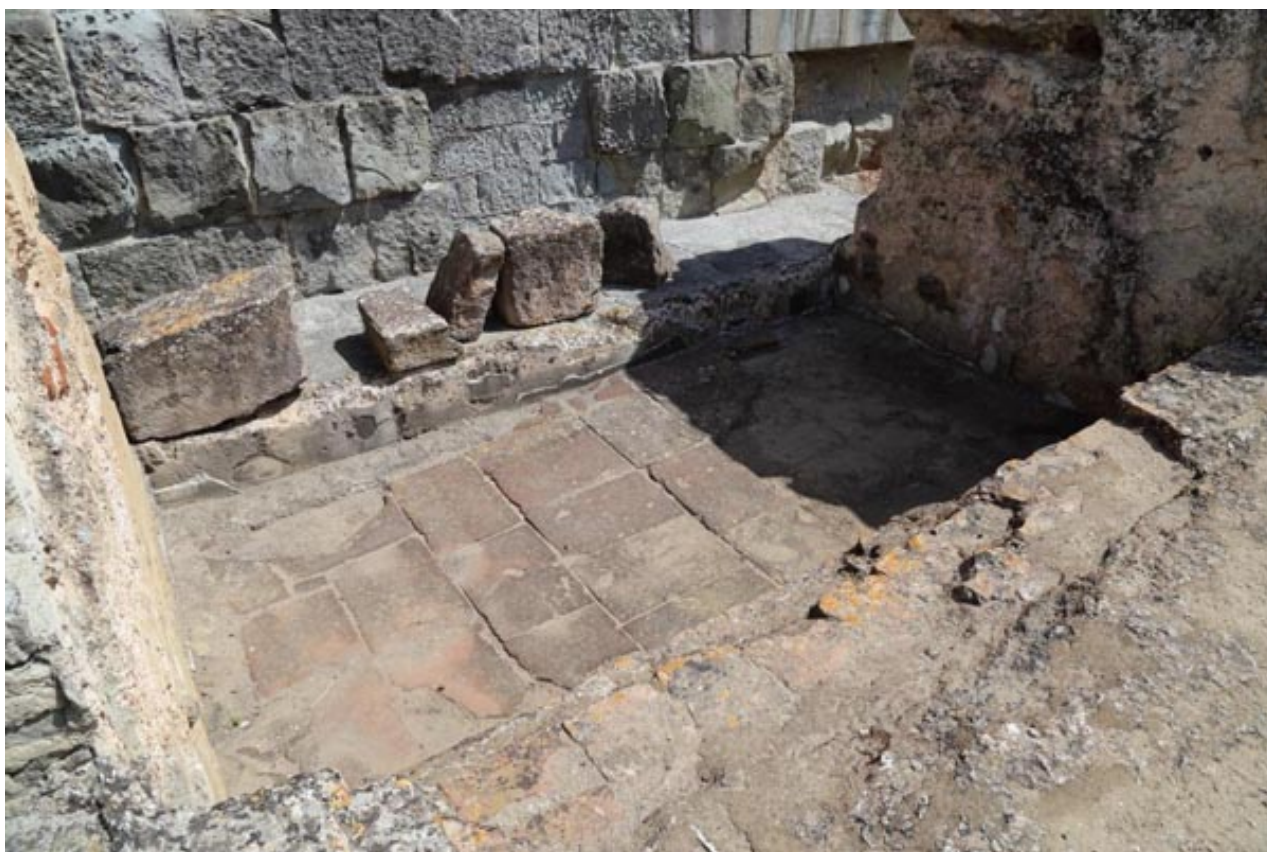
Fig. 4 - Bañera del frigidarium de las Termas II.

Sucesivamente, a través del tepidarium se accedía a dos calidaria , uno de los cuales contaba con una bañera con agua caliente (fig. 5). En el lado occidental se encontraban los ambientes de servicio y los hornos.