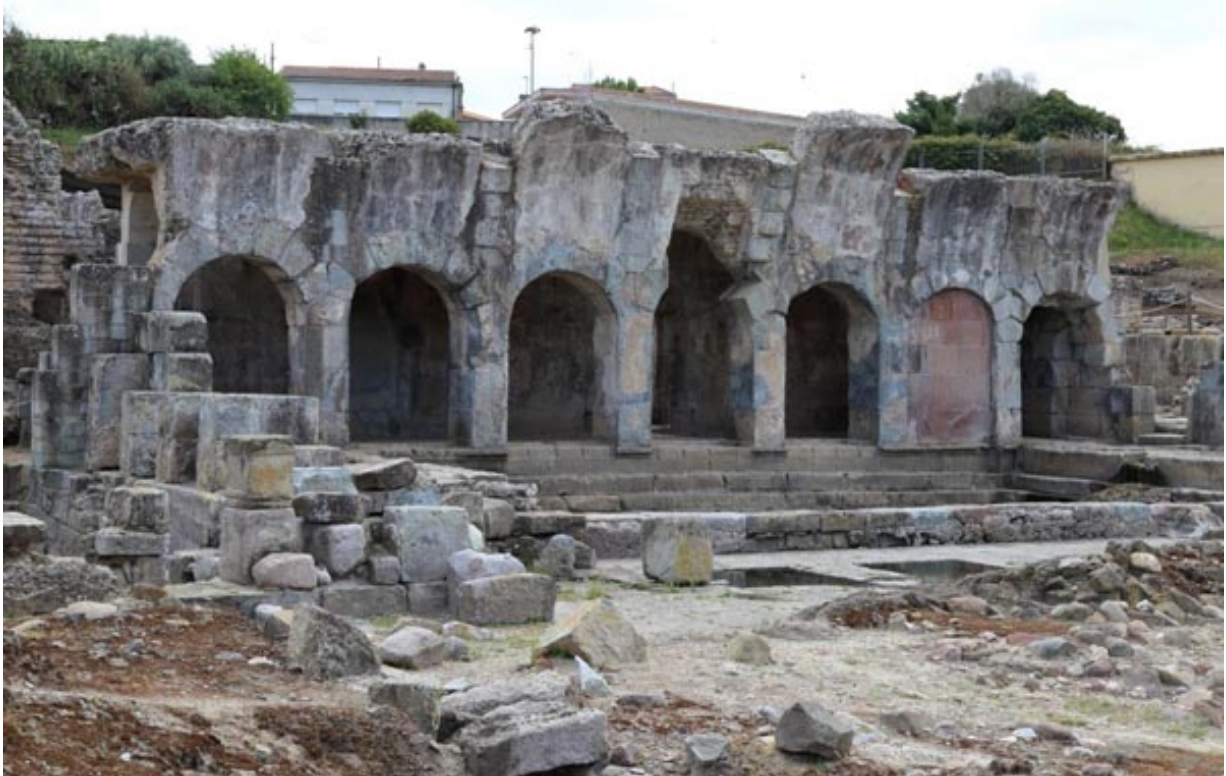
Fig. 3 - El núcleo de las Termas I: la natatio , y en primer plano el Ninfeo (foto de Unicity S.p.A.).