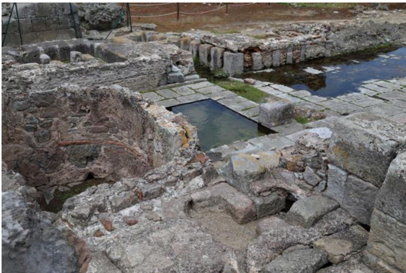
Fig. 5 - Los cuartos de servicio de las Termas I

A lo largo de los lados norte y sur de la piscina se observan dos pasillos con pórticos, mientras que en el lado occidental estaban las cisternas y los cuartos de servicio (fig. 5).