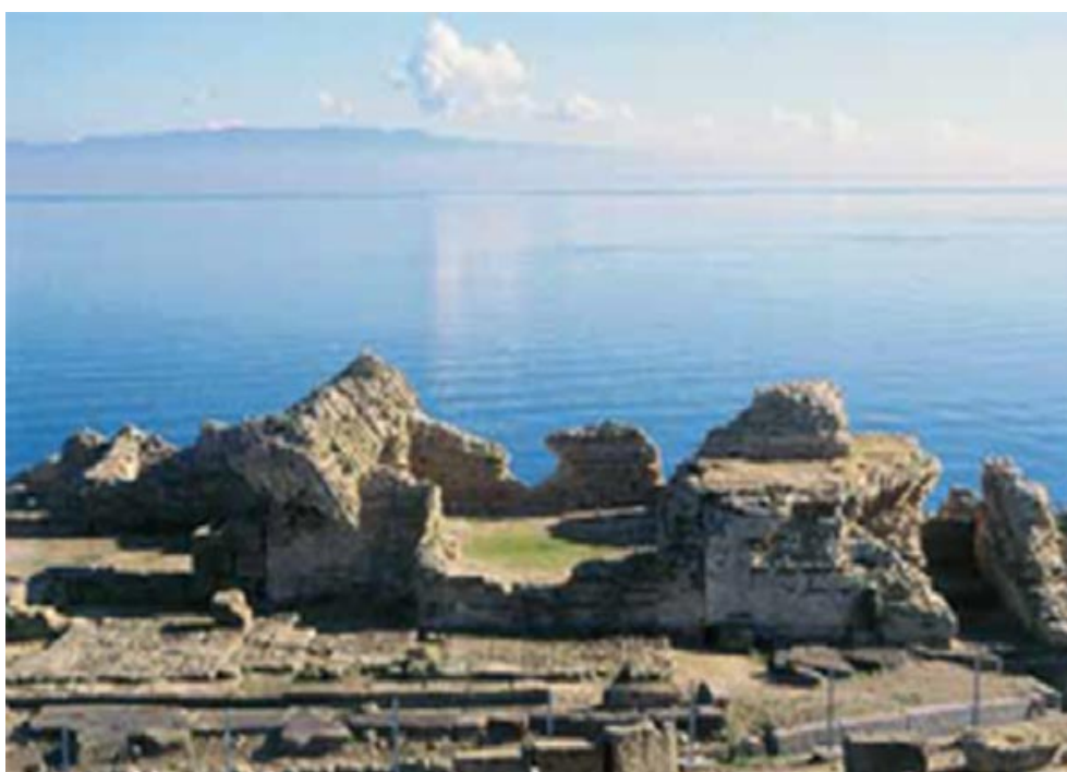
Fig. 4 - Tharros, Termas del convento viejo (de Acquaro-Finzi 2004, pág. 55).