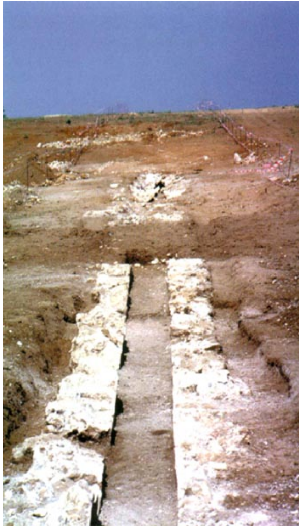
Fig. 4 - Restos del acueducto romano en el territorio de Assemini.