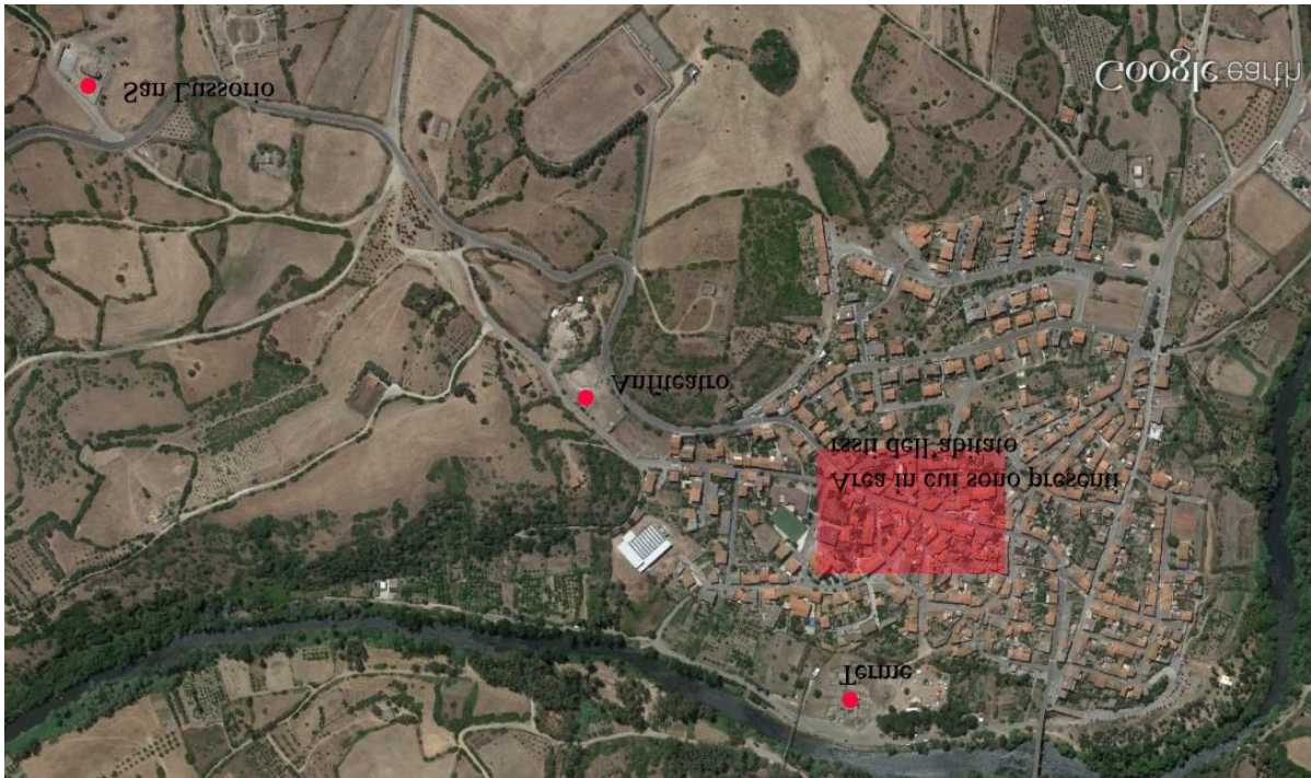
Fig. 2 - El territorio de Fordongianus donde se resaltan los lugares más importantes (de Google Earth; reelaborado por C. Tronchetti).

Además, también se han hallado algunos miliarios relativos a otras vías. Por otro lado, se han encontrado algunos tramos de carreteras cerca del puente sobre el río Tirso, en cuyas inmediaciones se han descubierto también los restos de un acueducto. Además, en la localidad actual se han identificado los restos de calles urbanas y edificios residenciales (fig. 3), aunque en menor cantidad. A principios del siglo pasado descubrieron algunas sepulturas aisladas en los alrededores.