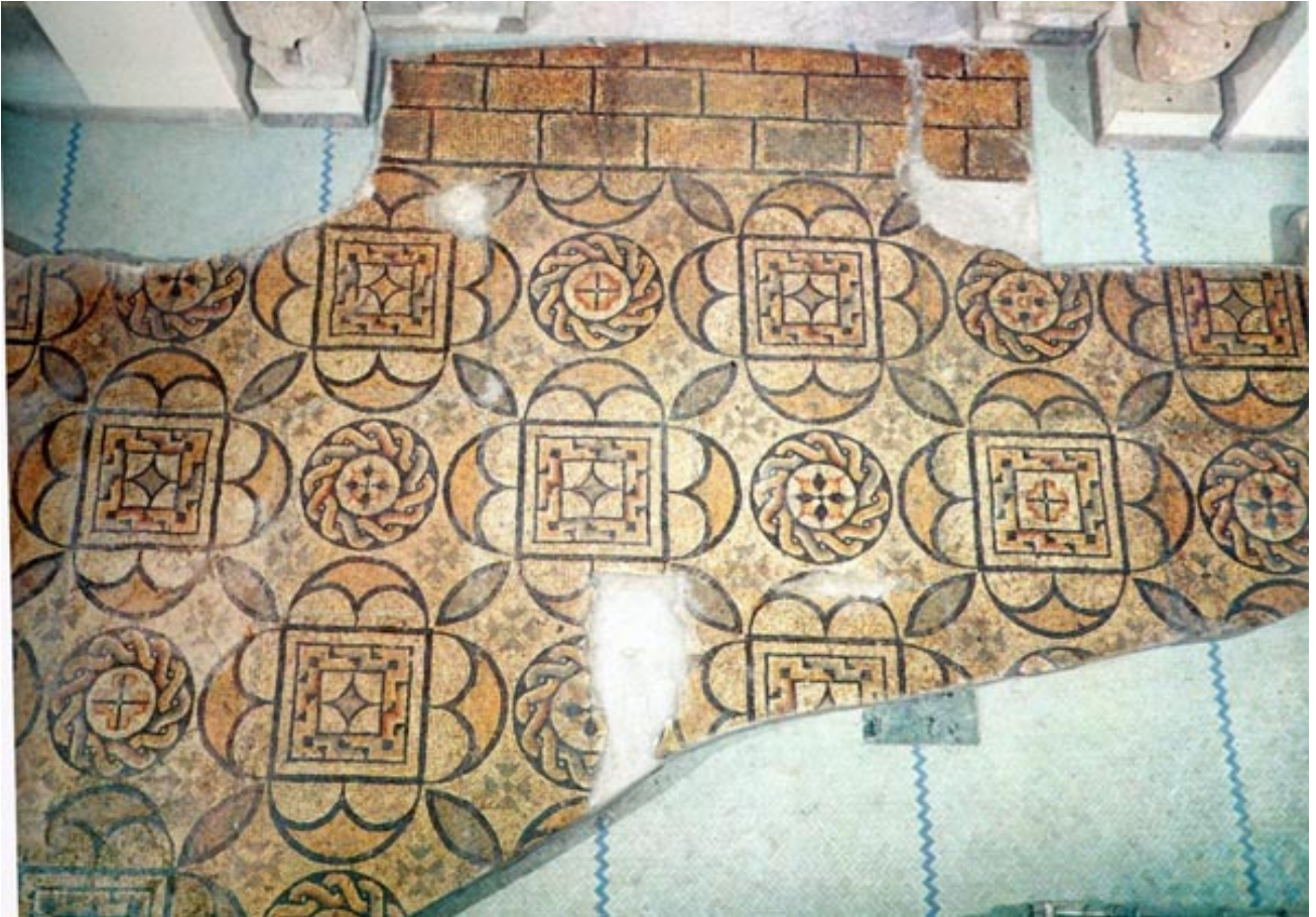
Fig. 3 - Suelo de mosaico hallado en la localidad de Fordongianus (de Angiolillo 1981, lám. XLIV).