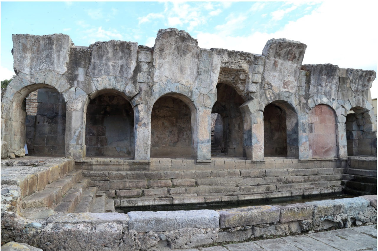
Fig. 1 - El porticado y la natatio de las Termas.

La ubicación del actual centro de Fordongianus de la antigua ciudad de Forum Traiani , vinculada con la fuente de aguas termales que había dado el nombre a la localidad de Aquae Hypsitanae haciendo referencia a una población autóctona, data de las primeras décadas del siglo IX.