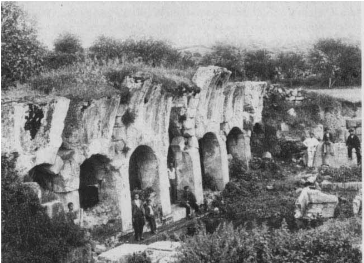
Fig. 2 - Vista del porticado tras las excavaciones de 1899 (de Taramelli 1903).

lo enmarcó históricamente en el contexto de "romanización" de la isla y arqueológicamente en los edificios termales del imperio romano.