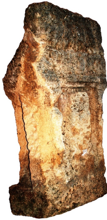
Fig. 2 - Estela púnica con betilo del s. V-IV a. C. (Oristán, Antiquarium Arborense )