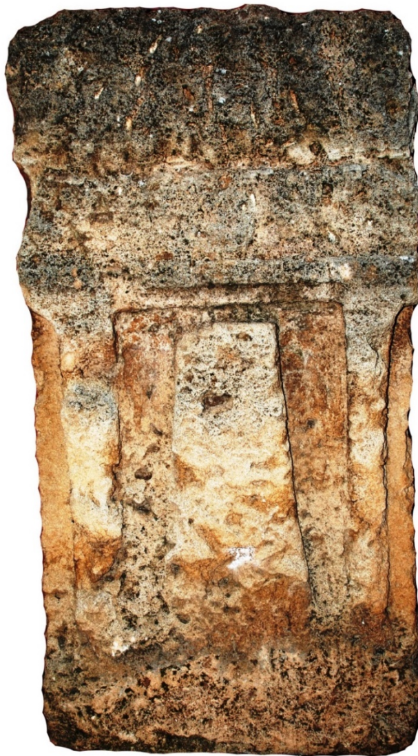
Fig. 1 - Estela púnica con betilo del s. V-IV a. C. (Oristán, Antiquarium Arboreense )

Una de las imágenes más comunes es la del betilo, el pilar sagrado, considerado sede de la divinidad (figs. 1-3).