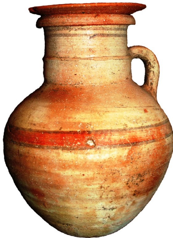
Fig. 1 - Jarra con cuello cilíndrico del tofet (Oristano, Antiquarium Arborense )

Las cenizas de los difuntos del tofet de Tharros las colocaban en urnas de varios tipos. En la fase más antigua, entre los siglos VII y V a.C., la forma más usada (211 ejemplares hallados en las excavaciones de 1971), fue la «jarra con cuello cilíndrico, con retallo o borde a la mitad hacia la parte superior» (figs. 1 y 2).