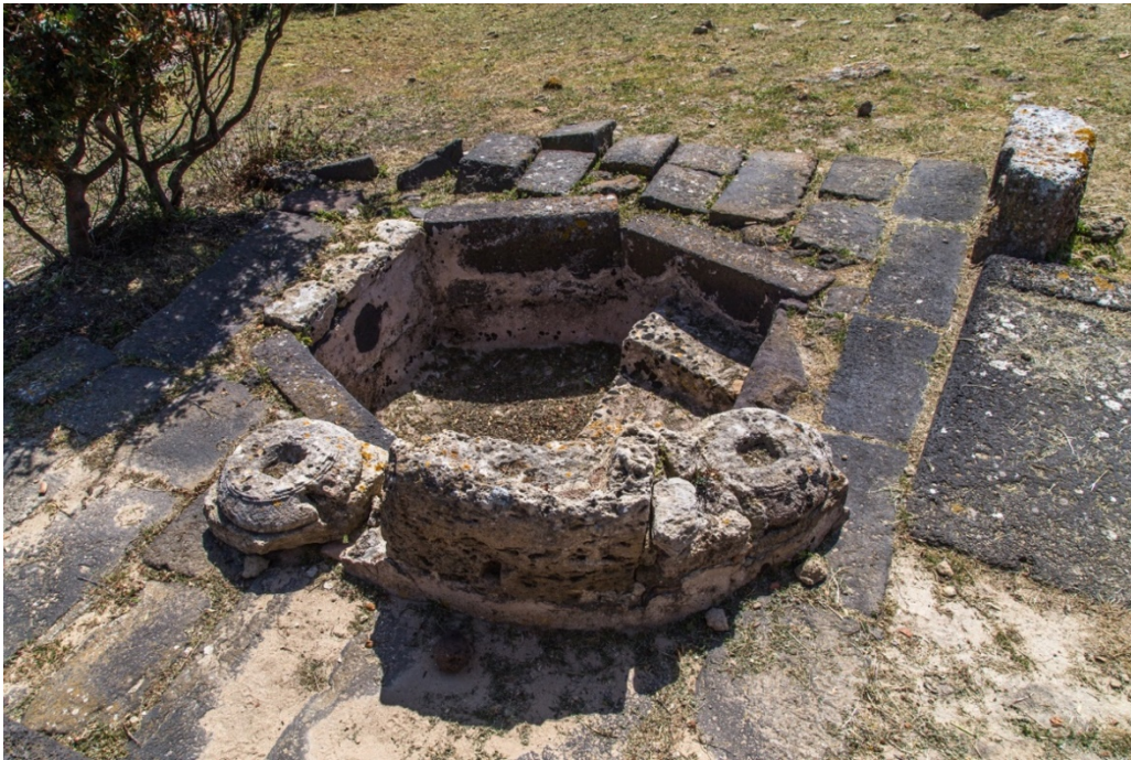
Fig. 4 - Los restos del baldaquín del baptisterio

La bañera pudo haber estado cubierta por un baldaquín, como lo demuestran los restos de dos columnas en el lado norte (fig. 4).