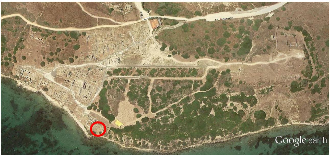
Fig. 1 - Ubicación del área paleocristiana (de Google Earth; reelaboración de C. Tronchetti)

Es muy significativa la transformación del sector norte de las Termas 1, ubicadas en el litorales del Golfo de Oristano (fig. 1).