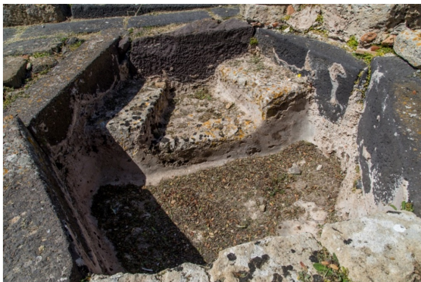
Fig. 5 - Detalle del banco de la bañera bautismal

El interior de la bañera incluye un banco de hormigón para la persona que se iba a bautizar (fig. 5).