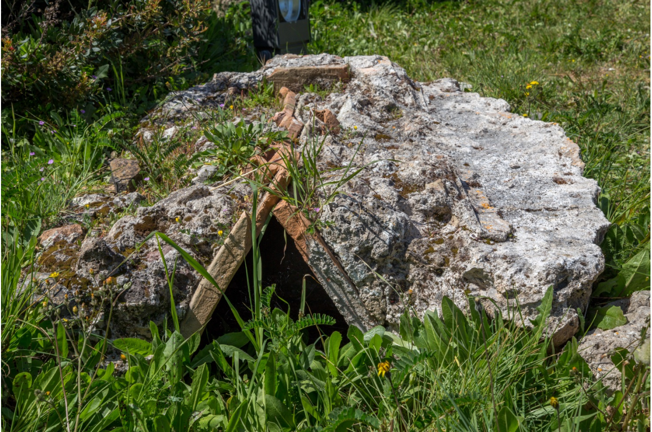
Fig. 9 - Tumba «a la capuchina» en un túmulo tipo cúpula

El túmulo en hormigón enlucido contenía la tumba que podía ser de tipo «cappuccina» (fig. 9), es decir, una simple caja de piedra.