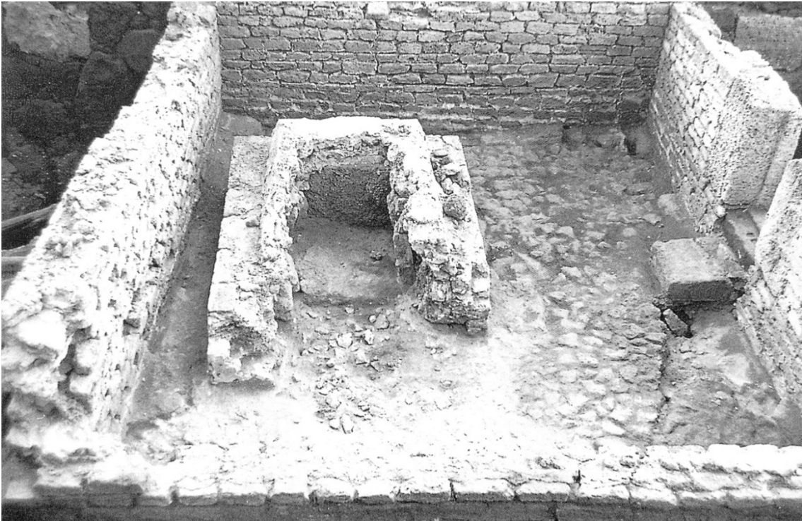
Fig. 2 - El pequeño mausoleo en el foso

El elemento más destacado de esta área de cementerio es un pequeño mausoleo compuesto por un recinto de bloques y con suelo empedrado, en el que había una tumba con forma de cúpula que ya habían saqueado, en cuya parte inferior había un modesto sarcófago de piedra. Este pequeño monumento data de las últimas décadas del siglo I d.C. (figs. 2-3).