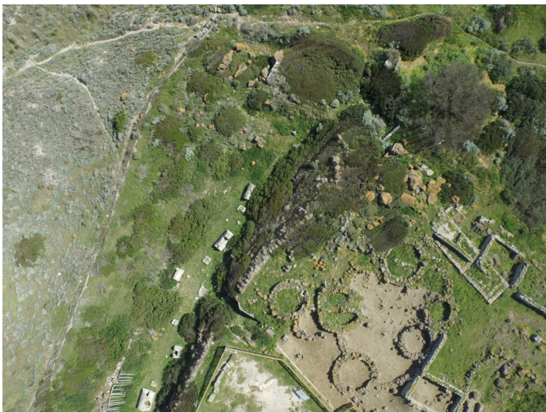
Fig. 1 - La necrópolis en el foso de Su Muru Mannu

Alrededor del año 50 a.C., en el interior del foso que llenaron parcialmente, en la colina de Su Muru Mannu, crearon una pequeña necrópolis de la primera era imperial (fig. 1).