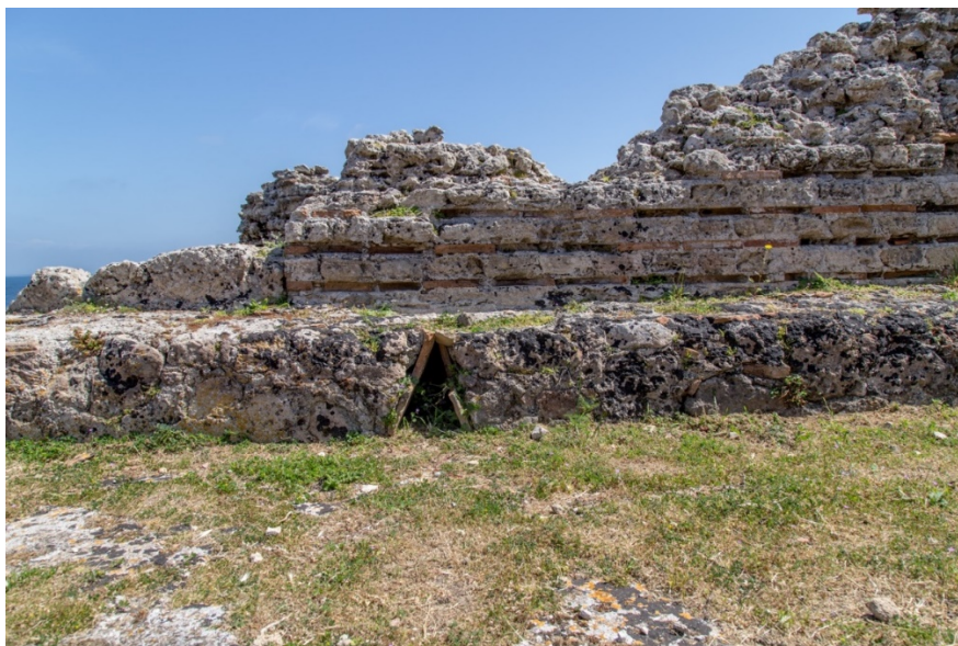
Fig. 6 - Banco del apodyterium , con el estípite para conservar los trajes

Del gran apodyterium (fig. 6) se pasa al frigidarium , con dos pequeñas bañeras: una semicircular y la otra rectangular (figs. 7-8).