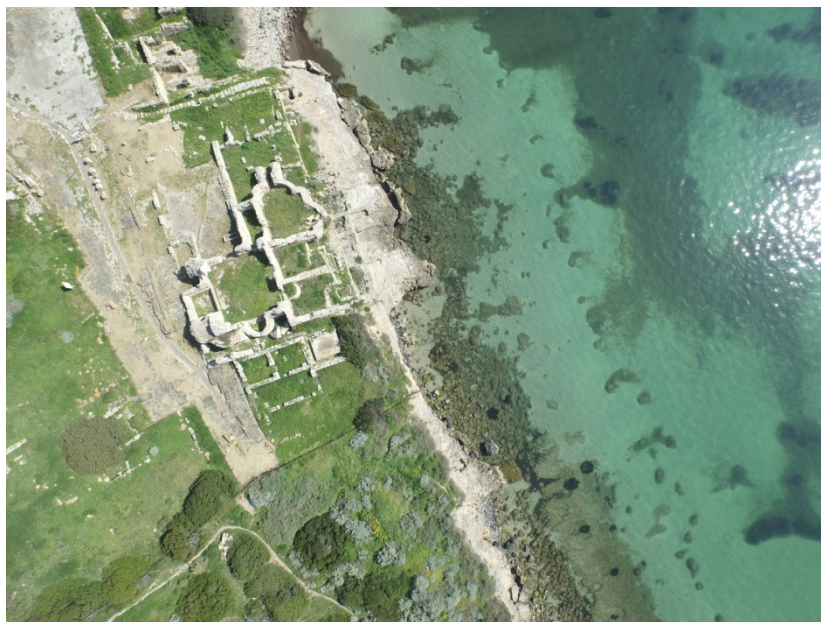
Fig. 2 - Las termas del Convento viejo