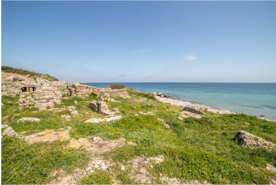
Fig. 4 - Las termas n.º 1, vistas desde el sur

La fecha de construcción de las Termas 1 podría datar del siglo II d.C. (figs. 4-8).