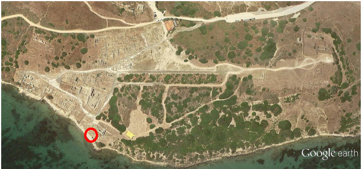
Fig. 1 - Ubicación de las termas n.º 1 (imagen de Google Earth; reelaboración de C. Tronchetti)

Este edificio termal, llamado así porque fue el primero en ser estudiado en el área de Tharros, está situado a lo largo de la costa que da al golfo de Oristán, en el extremo nororiental de lo que podríamos considerar la zona pública de la ciudad (figs. 1-2).