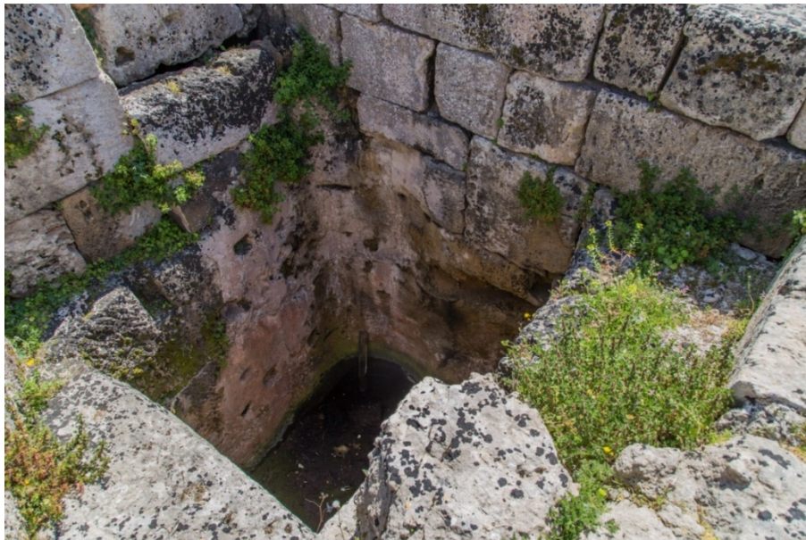
Fig. 5 - Cisterna grande de las Termas 1