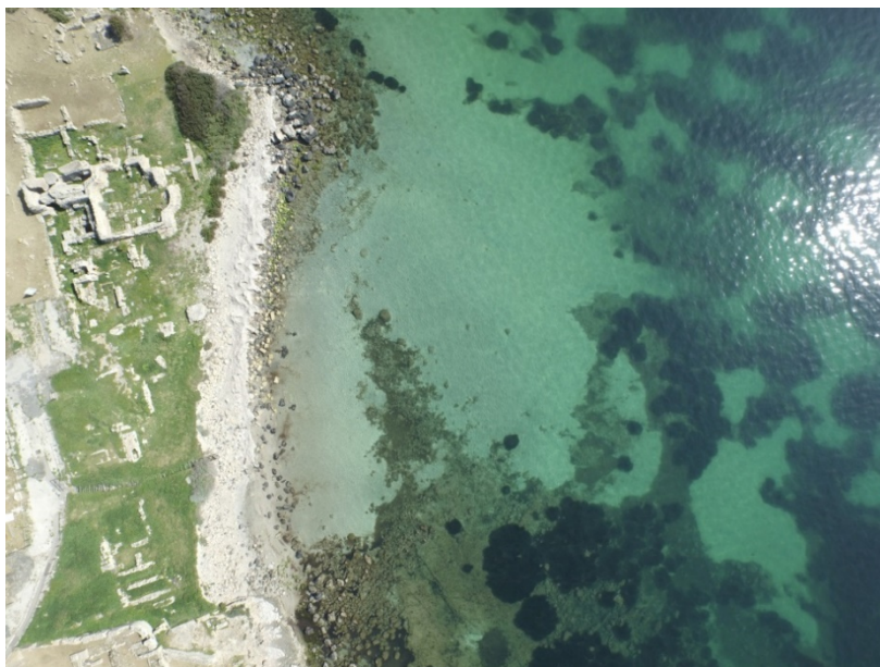
Fig. 2 - Las termas n.º 1