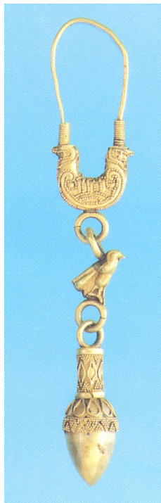
Fig. 3 - Pendiente dorado compuesto, de arriba a abajo, de una asa elíptica, un cuerpo en forma de hoz con prótomos de pájaro, un colgante de halcón y un colgante con forma de bellota (s. v a. C.)

Los ejemplares más antiguos, que datan del siglo VI a.C. en adelante, cuentan con formas bastante complejas: pendientes con varios colgantes, cuyos detalles destacan por haber sido realizados mediante la técnica de granulación.