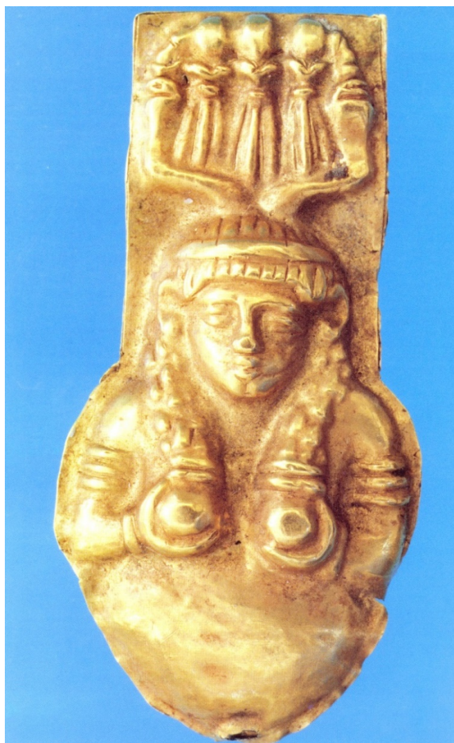
Fig. 6 - Colgante con una placa que representa a Isis que sostiene su pecho como si fuera a amamantar (sig. V a.C.) (de VV.AA. 1990, pág. 76)

Todo el mundo púnico también contó con joyas parecidas a las de Tharros, en particular en Cartago como, por ejemplo, el pendiente de cruz ansada (fig. 5) que fue ampliamente usado en los ajueres funerarios. Aunque, el hecho de que Tharros halla sido el único lugar donde se han encontrado ciertos elementos, refuerza la teoría de la producción local. Si tenemos en consideración que Cerdeña no tiene dicha materia prima, el oro, para producir la gran cantidad de joyas de Tharros, entonces estamos ante un claro indicio de la riqueza de la ciudad, que no se limita a la importación, sino que produce de forma autónoma sus propias joyas para después comercializarlas en el resto de la isla.