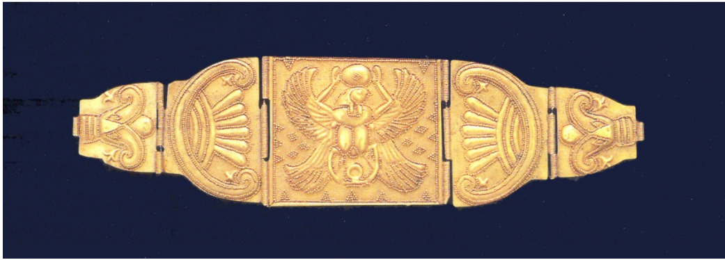
Fig. 2 - Pulsera de oro de Tharros (sig. VII-VI a.C.)

Los ejemplares más antiguos, que datan del siglo VI a.C. en adelante, cuentan con formas bastante complejas: pendientes con varios colgantes, cuyos detalles destacan por haber sido realizados mediante la técnica de granulación.