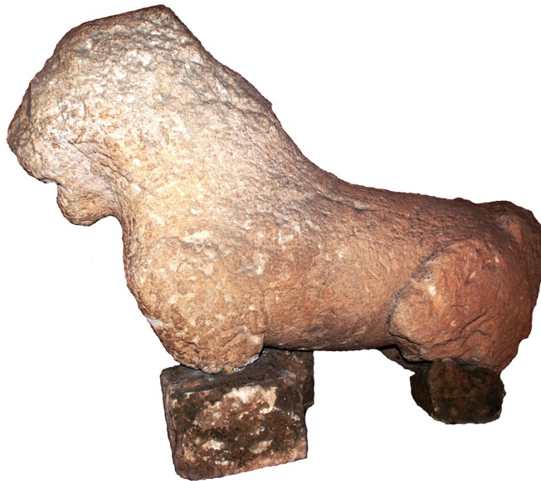
Fig. 9 - Estatua de un león de arenisca del templo de las semicolumnas