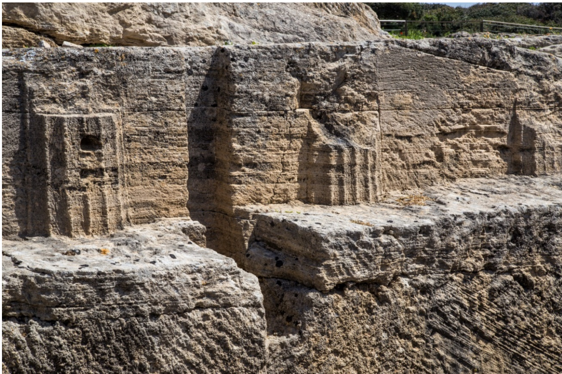
Fig. 6 - El templo de las semicolumnas: detalle de las columnas esculpidas en relieve