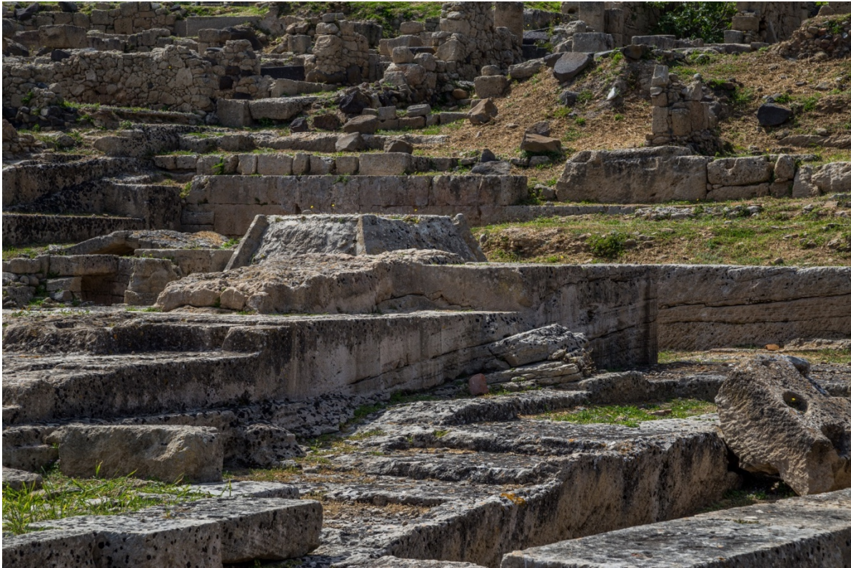
Fig. 4 - El templo de las semicolumnas

El nombre fue otorgado por el excavador Gennaro Pesce debido a la particular técnica de construcción de la estructura. De hecho, el basamento del templo fue excavado en la roca tras pulirla hasta obtener un podio con terraza. Las dos paredes largas y la posterior, también construidas mediante la misma técnica, fueron adornadas con semicolumnas en relieve (figs. 4-7).