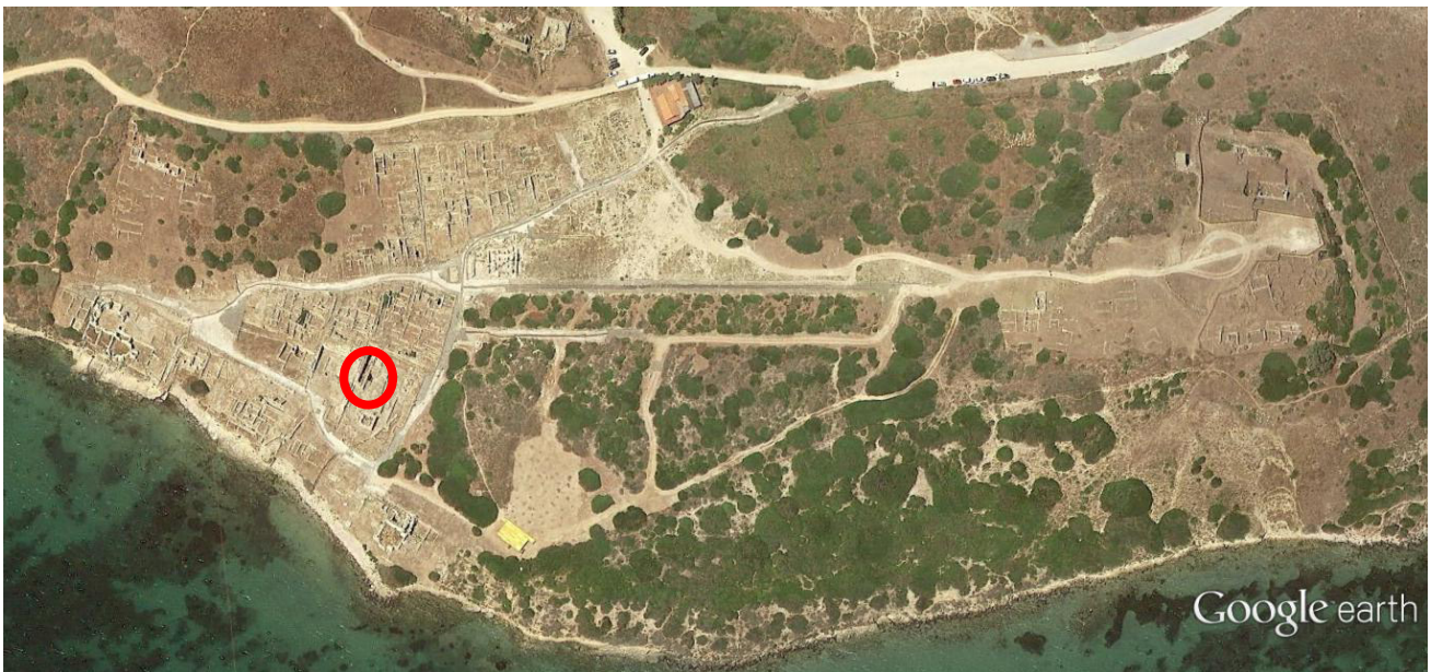
Fig. 1 - Ubicación del templo de las semicolumnas (imagen de Google Earth; reelaboración de C. Tronchetti)

La prueba más importante y significativa de Tharros de la era púnica que ha sobrevivido es, sin duda alguna, el «templo de las semicolumnas» (figs. 1-3).