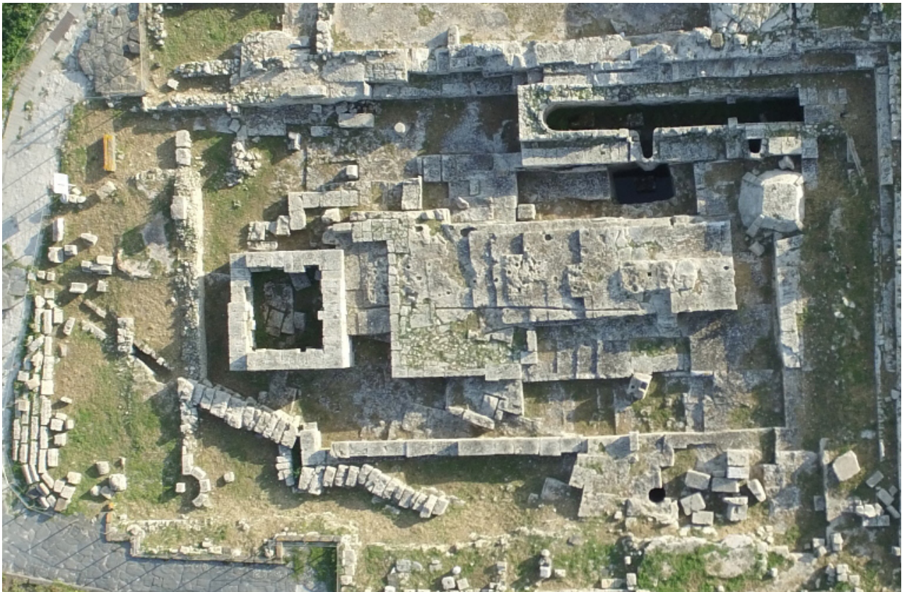
Fig. 3 - El templo de las semicolumnas: a la izquierda, los restos de una estructura romana; en la parte superior, la gran cisterna