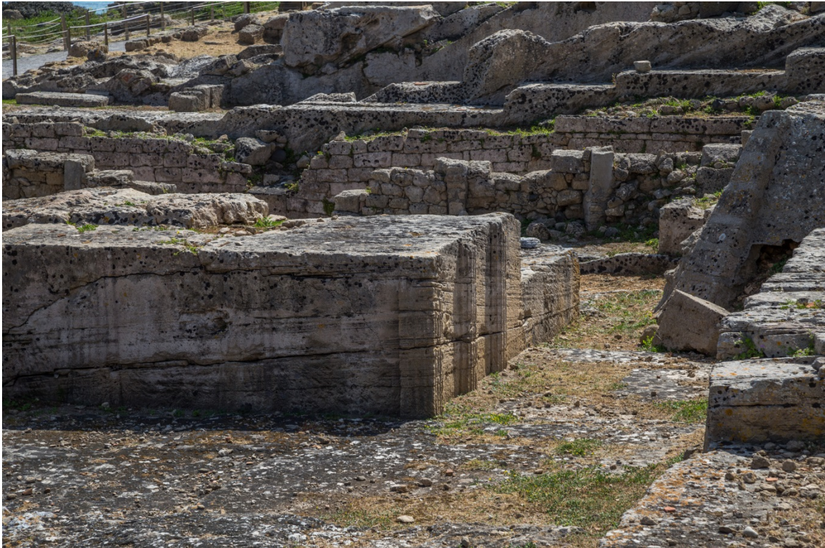
Fig. 5 - El templo de las semicolumnas: detalle de las columnas esculpidas en relieve