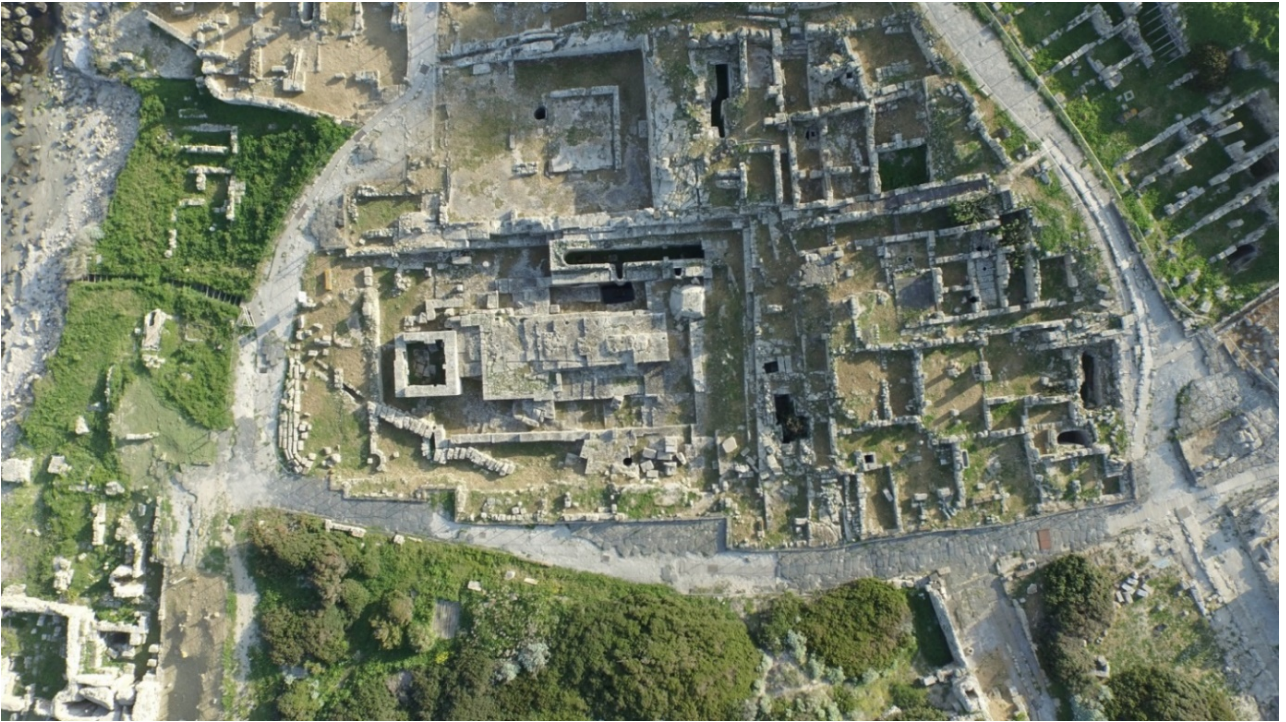
Fig. 2 - El templo de las semicolumnas destacado en el área