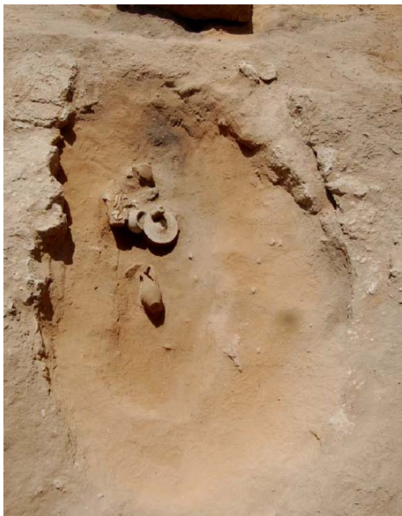
Fig. 5 - El ajuar de la tumba nº 56 (de Del Vais, Fariselli, 2012)

Los ajuares de las tumbas fenicias son esencialmente modestos y repetitivos, compuestos por dos jarras, una copa, un vaso de cocina y un plato (fig. 6).