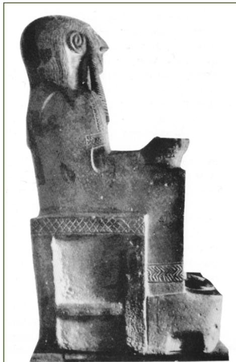
Fig. 5 - Fig.5. Siria. Tell Halaf. El "gran diosa" (MATTHIAE 1997, p. 195).

de Paringianu, que podría apoyar la hipótesis de una reproducción local en la época de la primera presencia fenicia en Monte Sirai.