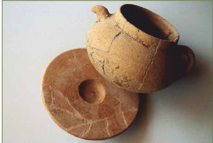
Figs. 3, 4 - Ejemplares de urnas con sus correspondientes tapas (GUIRGUIS 2013, fig. 44; MARRAS 1998, fig. 49).

La actual organización del lugar incluye algunas copias de urnas y estelas (fig. 5). En el Museo cívico arqueológico Villa Sulcis, en Carbonia, hay una reconstrucción del «campo de urnas».