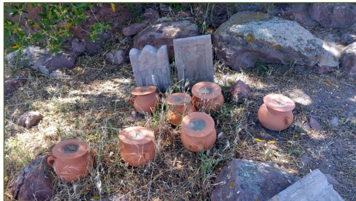
Fig. 5 - Reproducciones de urnas y estelas del tofet de Monte Sirai

La actual organización del lugar incluye algunas copias de urnas y estelas (fig. 5). En el Museo cívico arqueológico Villa Sulcis, en Carbonia, hay una reconstrucción del «campo de urnas».