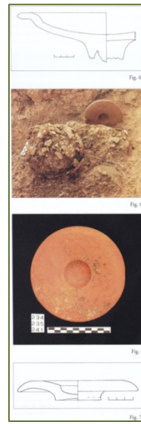
Figs. 3, 4 - Objetos de cerámica de las tumbas 234, 235 y 241 (GUIRGUIS 2010, figs. 64-70).