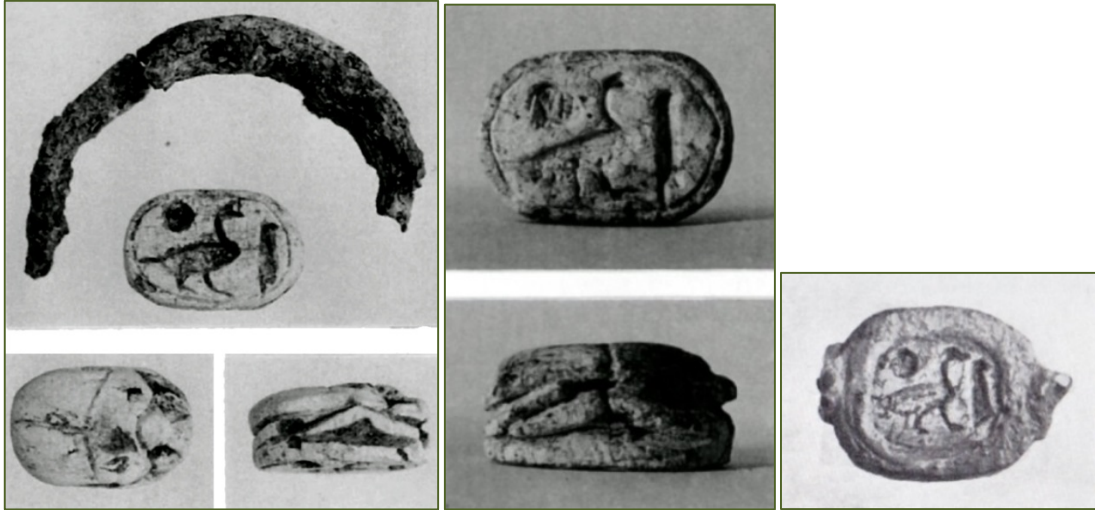
Figs. 4, 6 - Escarabeos de las tumbas 50 y 66 (BARTOLONI 2000, láms. XXVI, XXXVII); escarabeo del Museo arqueológico de Cagliari (MATTHIAE SCANDONE 1975, lám. V: B11).