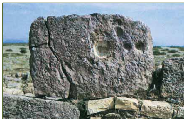
Figs. 3, 4 - El templo de Astarté (reelab. por foto Unicity S.p.A.) y el menhir con hendiduras (BARTOLONI 2004, fig. 4).

El análisis arqueológico ha permitido observar que los menhires fueron reutilizados en la era helenística, alrededor de las últimas décadas del siglo III a.C. Son la evidencia de una fase prehistórica anterior cuyas muestras se hallaron en las estructuras de construcción y los materiales de la cultura de Monte Carlo, entre la altura del tofet y la necrópolis hipogeica, además de en la localidad y en la tumba nº 207