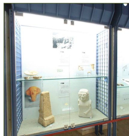
Figs. 3, 4 - Reconstrucción del nuraga Sirai; vitrina con varios materiales fenicios y la estatua de Astarté.