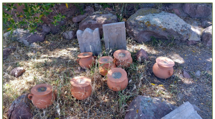
Figs. 3, 4 - Planimetría del tofet con la distribución y los tipos de urnas (GUIRGUIS 2013, fig. 7); reproducción de urnas y estelas del tofet de Monte Sirai (foto de MANCA DI MORES, 2015)