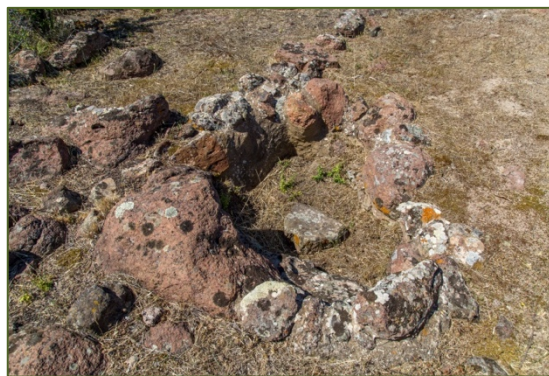
Figs. 6, 7 - Ambientes y los fogones del santuario del tofet.