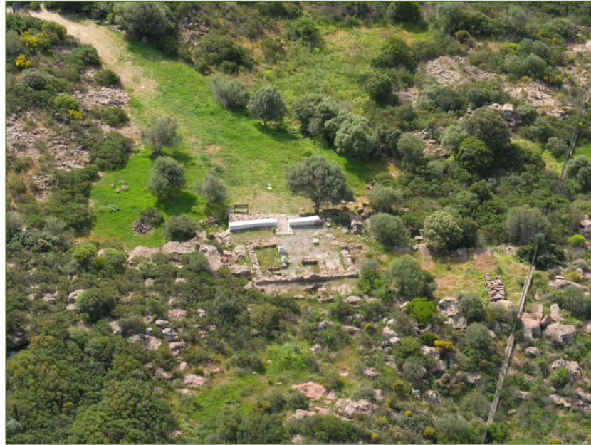
Fig. 2 - El área del tofet (GUIRGUIS 2013, fig. 7).

El santuario está formado por un área funeraria en la que las urnas, de forma muy similar y con las cenizas de los niños fallecidos, estaban cubiertas por pequeños platos y enterradas (se han hallado aprox. 400; fig. 3), dejando a la vista, aunque no todas, una marca formada por una estela de piedra con varias figuras: en algunos casos de estilo egipcizante, otros grecizante o más lineales, y en otros casos, en sacelios o sagrarios que hacen referencia a modelos templarios (fig. 4).