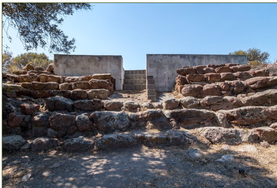
Fig. 5 - Las escaleras del tofet.

Desde el área funeraria, había unos escalones (no los 7 escalones de la escalera monumental, reconstruida en numerosas ocasiones por las excavaciones de la década de 1960 (fig. 5), que tendrá que volver a reestructurarse), llevaban a una rampa, y por último,