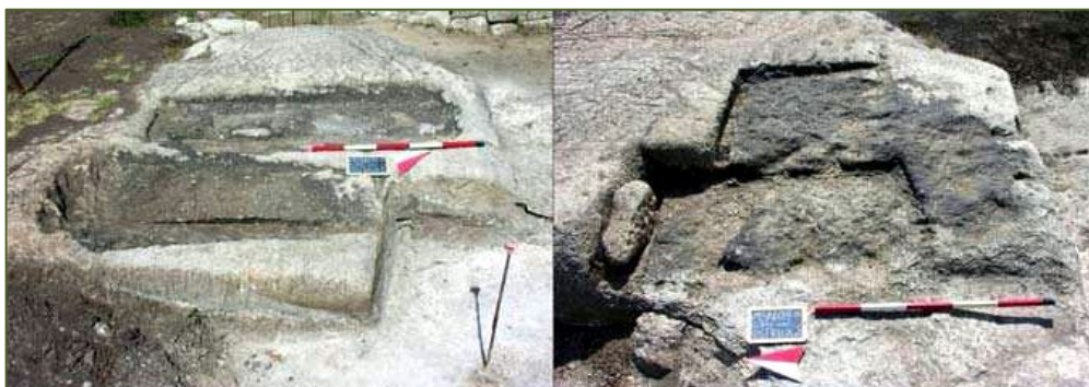
Fig. 3 - Lugares donde se encontraba el ustrinum colectivo (GUIRGUIS 2012, fig. 6).

En la misma época también hubo otros rituales relacionados con la incineración. Se distingue la presencia de bancos de toba con ustrinum colectivo (fig. 3), un lugar reservado a la incineración que precedía la deposición fúnebre en las tumbas de fosa.