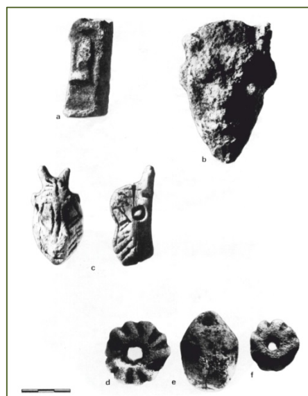
Figs. 4, 6 - Material arqueológico de la tumba (BARTOLONI 1987, láms. I-III).